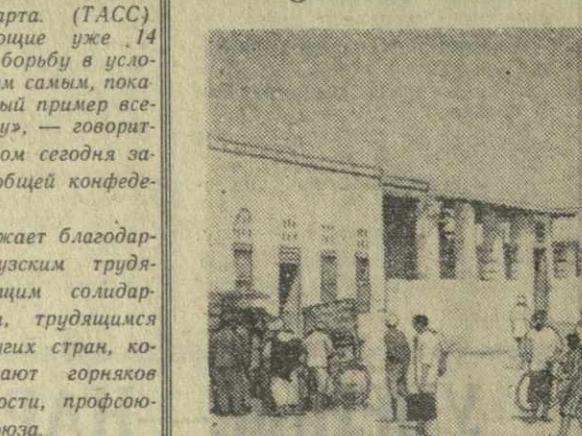
В Йеменской Аравийской Республике. Больница в портовом городе Ходейда. Здесь работают десять советских врачей различных специальностей. Они пользуются большой популярностью у населения, которое охотно обращается за помощью к советским медикам.

Комментатор ТАСС И. Володин пишет: Закон о земельной реформе был принят иранским правительством в начале прошлого года. В соответствии с этим законом владения помещиков ограничиваются одной деревней (крупнейшие помещики владеют 100 — 150 деревнями с прилегающими землями, пр-