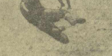
Футболисты тренируются на стадионе.

Нагрузку. Каждой команде придется только в чемпионате провести 38 игр. Никогда еще в истории фут-