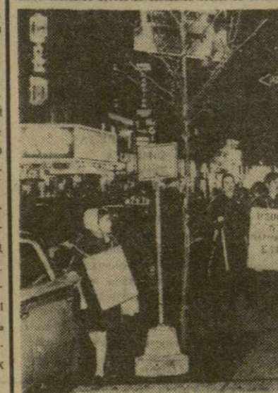
Американские граждане осуждают решение правительства США о возобновлении ядерных испытаний и политику, угрожающую делу мира. В Вашингтоне женщины с детьми и студентами пикетировали Белый дом. В Нью-Йорке состоялись массовые демонстрации.

На снимке: колонна демонстрантов в Нью-Йорке.