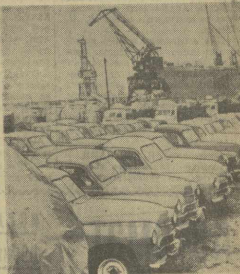
В Польской Народной Республике все большее развитие получает автомобилестроение. К концу пятилетнего — 1965 году — польские заводы будут выпускать более 30.000 грузовых автомобилей, почти 37.000 легковых автомобилей и около 4 тысяч автобусов. На снимке: автомашины, предназначенные для отправки на Кубу, в Гданьском порту.

Они указывают, что число американских военных кораблей в оперативной группе США, патрулирующих вдоль побережья Тайваня, на прошлой неделе явно увеличилось.