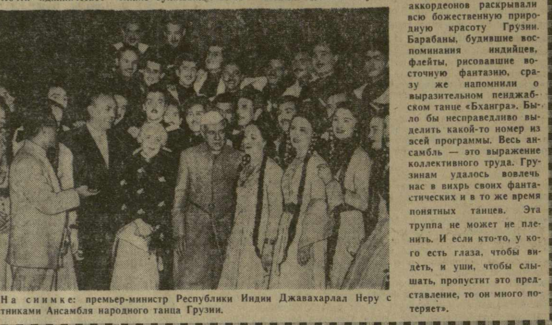
На снимке: премьер-министр Республики Индии Джавахарлал Неру с участниками Ансамбля народного танца Грузии.

художественное оформление и чистая поэзия, которой были пронизаны все движения в танцах, ослепляли зрителей. Все танцы были выбраны, безусловно, с самой большой тонкостью, на которую способен только Илько Сухишвили. Он довел ансамбль до уровня, когда его участники проникнуты единым стремлением сделать возвышенное движение».