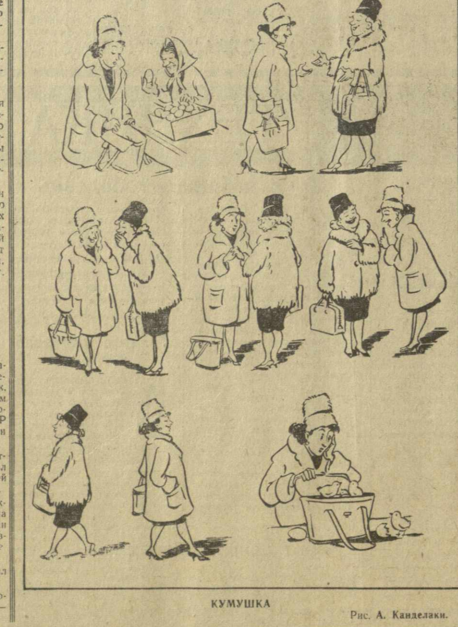
КУМУШКА