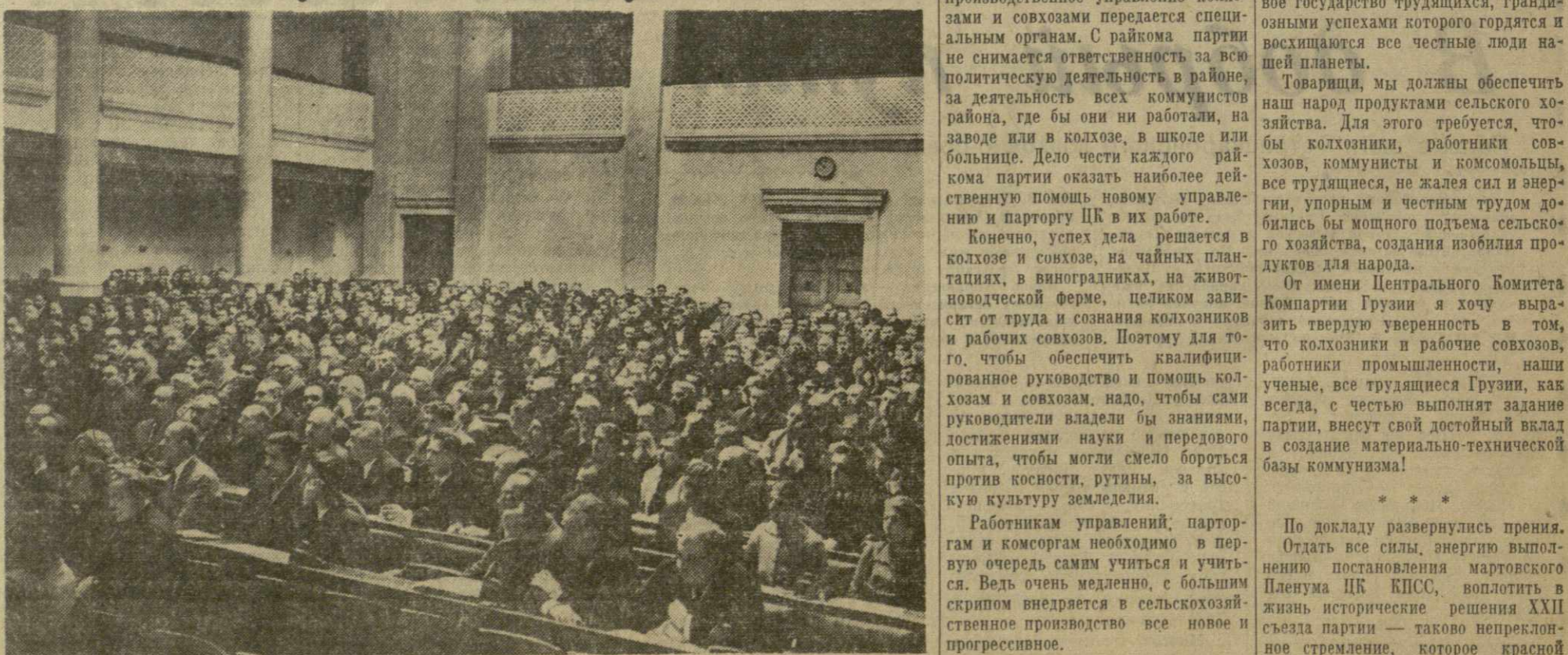
Пленум Центрального Комитета Компартии Грузии. На снимке: в зале заседаний.

По докладу развернулись прения. Отдать все силы, энергию исполнению постановления мартовского Пленума ЦК КПСС, воплотить в жизнь исторические решения XXII съезда партии — таково непреклонное стремление, которое красной нитью проходило в выступлениях участников пленума.