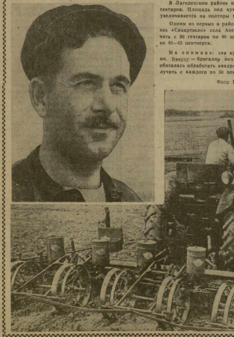
В Лагодском районе начался сев кукурузы. Засеваются 4 тысячи гектаров. Площадь под кукурузой по сравнению с прошлым годом увеличивается на полторы тысячи гектаров.

НЬЮ-ЙОРК, 29 марта. (ТАСС). Как сообщают информационные агентства из Буэнос-Айреса, государственные секретари по армии и военно-воздушным силам объявили, что президент Аргентины Артуро Фрондиси смещен со своего поста. Представители высших военных кругов объявили, что на посту президента страны его сменил председатель сената Хосе Марно Гидо. По последним сообщениям, Фрондиси находится в своей резиденции в Оливос (предместье Буэнос-Айреса). Как указывает корреспондент агентства АП, ссылаясь на заявления представителей военных кругов, Фрондиси в случае отказа уйти в отставку будет арестован и сослан на остров Мартин Гарсиа. В поступающих из Буэнос-Айреса телеграммах говорится, что войска заняли ключевые позиции в городе.