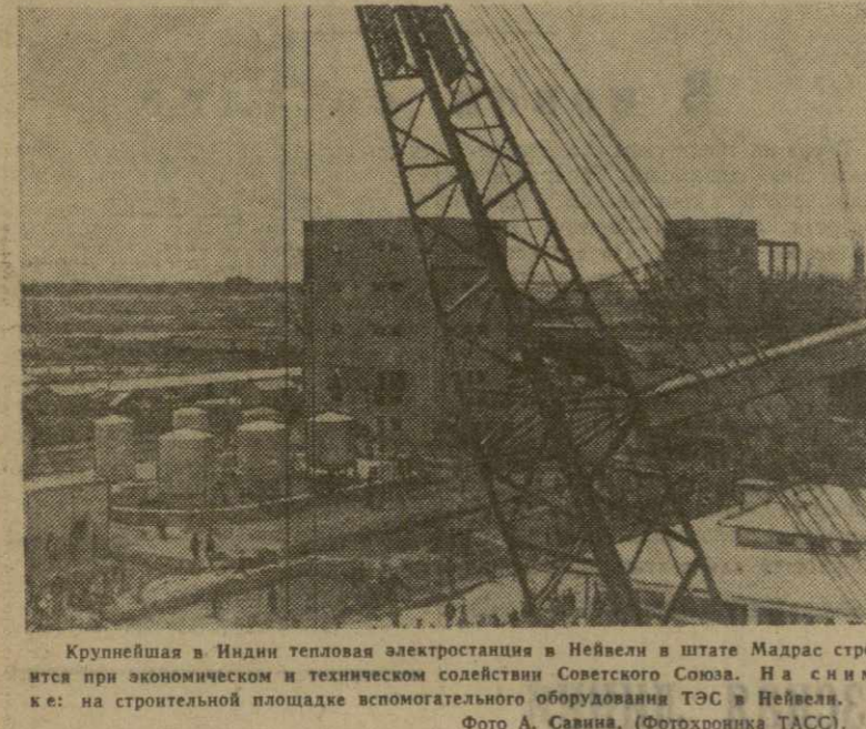
Крупнейшая в Индии тепловая электростанция в Нейвели в штате Мадрас строится при экономическом и техническом содействии Советского Союза. На снимке: на строительной площадке вспомогательного оборудования ТЭС в Нейвели.

ПАРИЖ, 2 апреля. (ТАСС). Осавцы продолжают в алжирских городах свои кровавые преступления. За последние два дня в результате действий этих убийц погибли 23 человека. В ряде районов бандиты из ОАС организуют вооруженные нападения на подразделения французской ар-