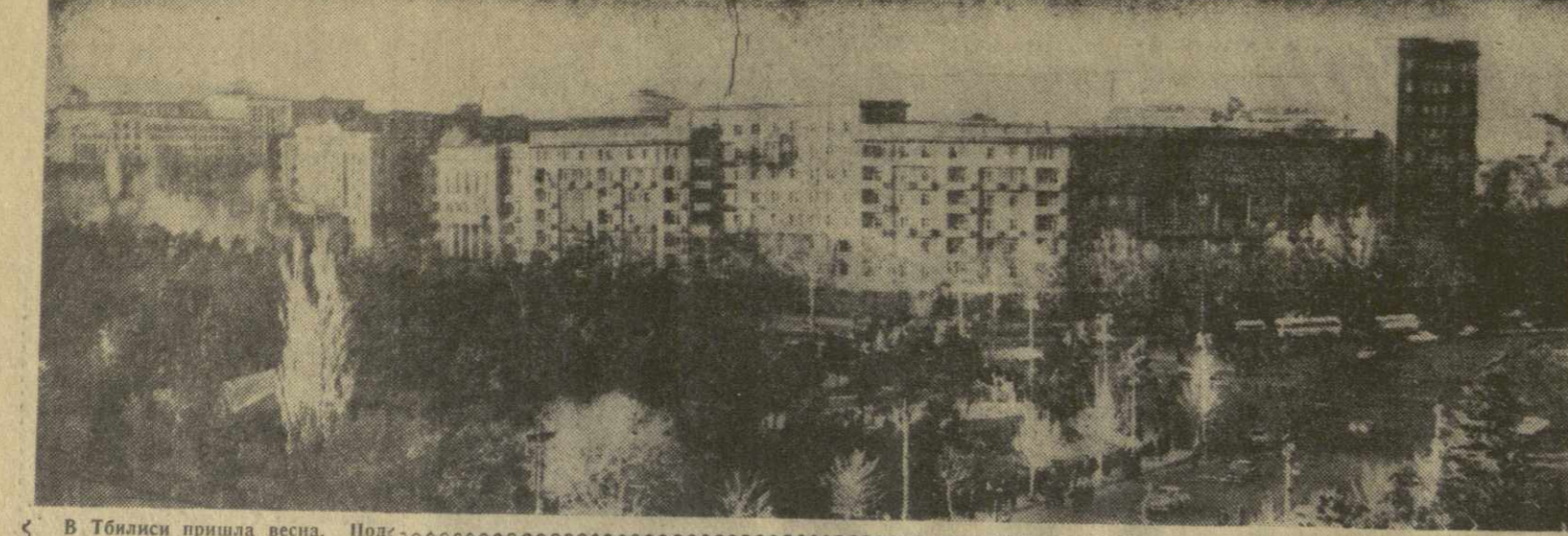
В Тбилиси пришла весна. Под лучами яркого солнца распустились нежные почки на деревьях, в парках и садах цветет миндаль. Чистые, словно умытые, проспекты и улицы, кварталы новых жилых домов выросли за последние годы в столице нашей республики. И в эти весенние дни город выглядит особенно празднично и нарядно.

Сотни писем с благодарностью приходят к ним работников адресного бюро. (ГрузТАГ).