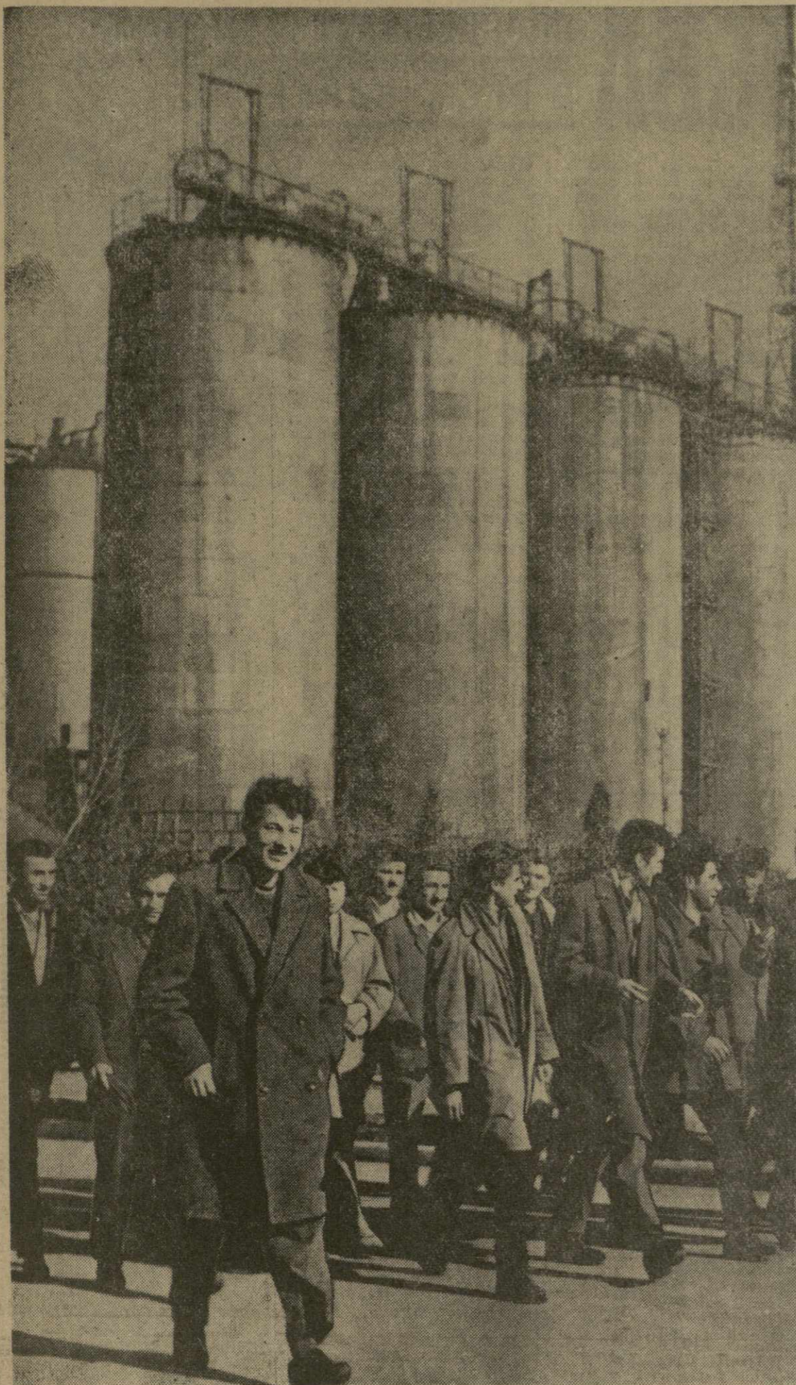
Руставский азототуковый завод. Идет смена.