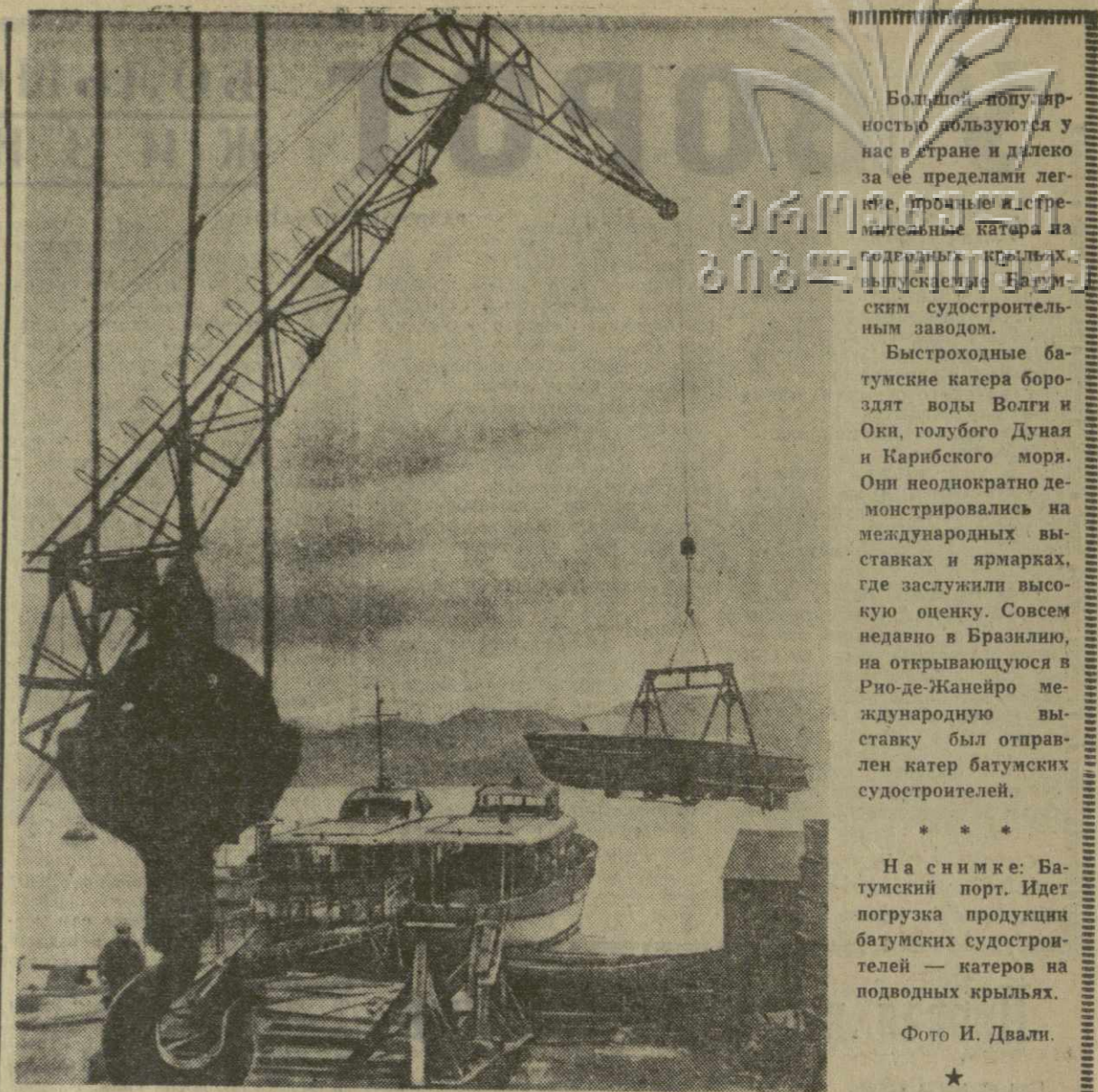
На снимке: Батумский порт. Идет погрузка продукции батумских судостроителей — катеров на подводных крыльях.

В результате автомобильных аварий за последний квартал 1961 года на дорогах Англии погибли 1.957 человек.