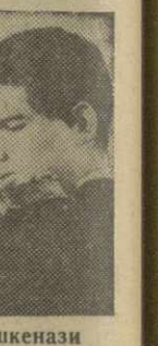
Ш. Ашкенази (Израиль)