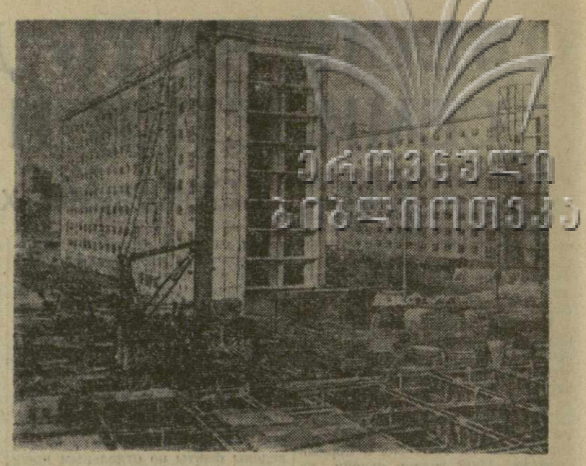
ГДР. Карл-Маркс-Штадт. Тысячи жилищ и многие предприятия были разрушены во время войны англо-американской авиацией. Город пришел фактически отстоять заново. Карл-Маркс-Штадт стал крупным центром социалистического строительства. На снимке: новое жилье дома на одной из строительных площадок.

ЛЕОПОЛЬДВИЛЬ, 19 апреля. (ТАСС). Вчера здесь возникли инциденты в связи с попыткой главаря катангских сепаратистов Чомбе вылететь в Элизабетвил. В середине дня без ведома конголезского правительства Чомбе был доставлен на вертолете ООН в аэропорт Иджилли, откуда он должен был вылететь в Элизабетвил. В момент, когда самолет ООН, на борту которого уже находился Чомбе, вырвался на взлетную дорожку, ему загорючили путь две грузовые машины. Вылететь в Элизабетвил Чомбе не удалось. Конголезские сотрудники службы безопасности заявили представителям командования войск ООН в связи с тем, что оно не информировало конголезское правительство о намерении Чомбе возвратиться в Катангу. Как известно, в Леопольдвиле уже больше месяца ведутся переговоры о будущем Катанги между катангской делегацией и центральным правительством Конго. Создается впечатление, что Чомбе решил отказаться от дальнейших переговоров и начать разговаривать языком силы.