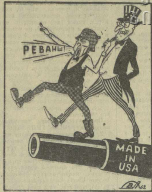
ОПАСНЫЕ СВЯЗИ. Рис. В. Аброва.

В Токио прибыли участники сидячей забастовки протеста, проходящей в городе Хирогима, в которой участвует более 3 тысяч человек. С белыми повязками на головах они пришли сегодня в американское посольство и от имени 450-тысячного населения Хирогимы потребовали от США прекратить ядерные взрывы. (ТАСС).