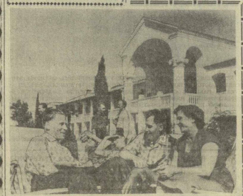
На снимке: группа отдыхающих в гудайтском санатории «Волга».

В заключение вечера состоялся концерт, прошедший с большим успехом, и просмотр кинофильма «Алжирский дневник».