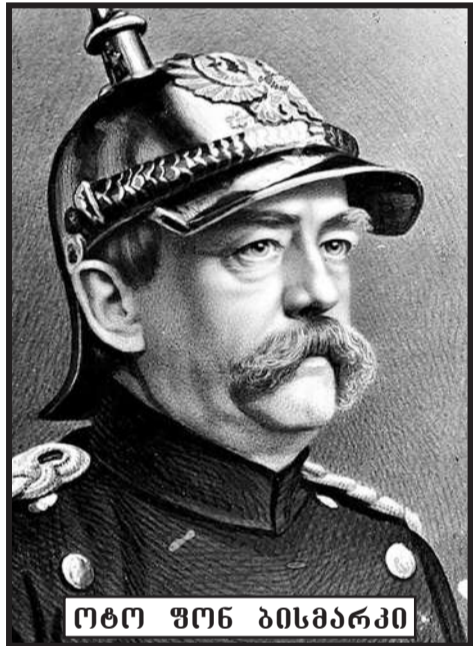
ოტო ფონ ბისმარკი