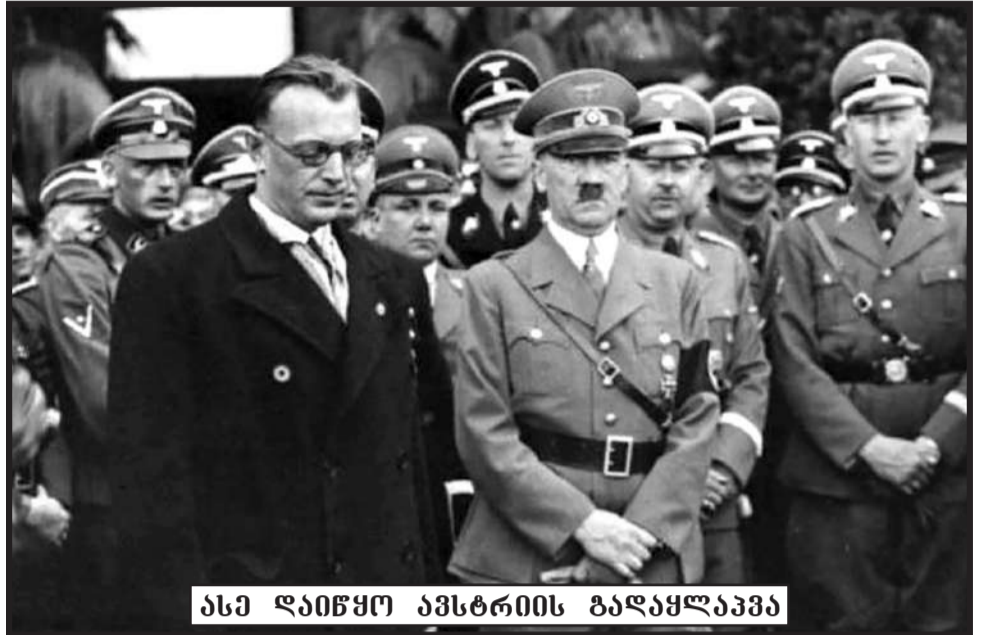
ასე დაიწყო ავსტრიის გააყვანება

თავიდან აცილებას ცდილობდნენ. ჰიტლერის აღზრდას თავად ავსტრიაში ქარსი მოჰყვა, სადაც პოლიტიკური ცხოვრების წესს რადიკალური ადგილები ჰქონდა. ჰიტლერმა საბავარიის დიქტატორული მეთოდი და ავსტრო-ფაშისტური იდეოლოგიურად ახლოს იდგა იტალიურ ფაშისტთან და როგორც მსოფლიო მეთაურობდა. ნაცისტებსა და კომუნისტებს ავსტრო-