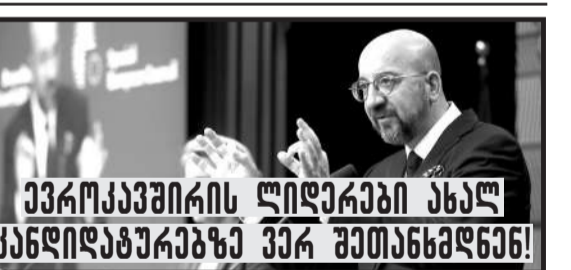
ევროკავშირის ლიდერები ახალ კანდიდატურაზე პირ შეთანხმდნენ!

ბრიუსელში ევროკავშირის სამიტის მონაწილეებმა გაერთიანების ახალი ხელმძღვანელობის დანიშვნაზე საბოლოო შეთანხმებას ვერ მიაღწიეს. ამის შესახებ სამიტის დასრულების შემდეგ ევროპული საბჭოს პრეზიდენტმა შარლ მიშელმა განაცხადა.