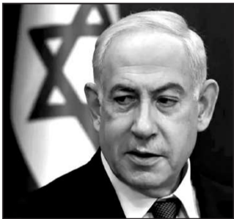
ისრაელის პრემიერ-მინისტრმა ბენიამინ ნეთანიახუმ ექვსწევრიანი ომის კაბინეტი

დაითხოვა, – ამის შესახებ ინფორმაციას Reuters-ი ისრაელის მთავრობის ოფიციალურ წარმომადგენლებზე დაყრდნობით ავრცელებს.