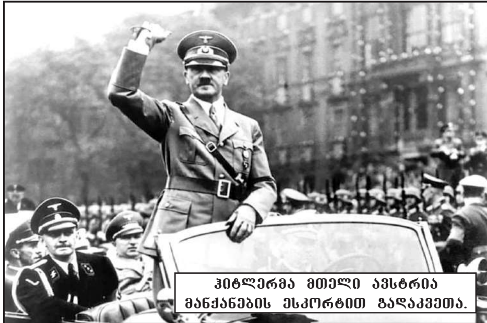
ჰიტლერმა მთელი ავსტრია მანქანების ესკორტით გააყვანა.

1937 წელს გერმანიის ქალაქ ობერზალცბერგში ჰიტლერი ბრიტანეთის ლორდთა პალატის ლიდერს ედვარდ ჰალიფაქსს შეხვდა, რომელმაც განაცხადა, რომ ინგლისი და საფრანგეთი Anschluss-ის წინააღმდეგ არ წავა.