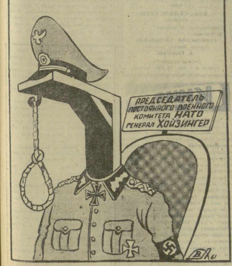
ПОРТРЕТ УБИЙЦЫ.