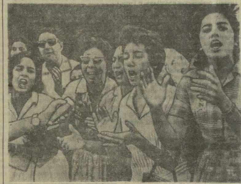
Массовые выступления трудящихся Доминиканской Республики вынудили президента Баллера, ставленника бывшего диктатора Трухильо, согласиться на переговоры с оппозицией. Президент Баллер заявил, что снимет с себя президентские полномочия в 1962 году. Будет создано коалиционное правительство, включающее представителей оппозиции.

Суверенитет Германской Демократической Республики, говорится в ноте, означает ее ограниченный суверенитет в отношении всех проходящих по ее территории путей сообщения. Руководствуясь интересами облегчения соглашения между государствами антигитлеровской коалиции о германском мирном договоре и мирном урегулировании вопроса о Западном Берлине, Германская Демократическая Республика до сих пор терпит перевозку грузов для дислоцированных в Западном Берлине оккупацион-