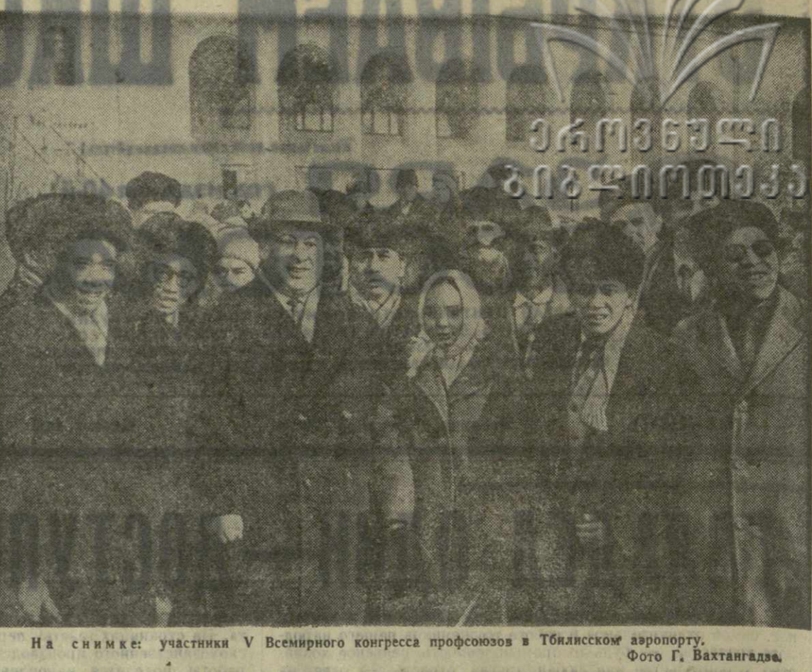
На снимке: участники V Всемирного конгресса профсоюз в Тбилиском аэропорту.

В невиданном быстром экономическом и культурном расцвете всех союзных республик в том числе и Грузии, ярко проявилась великая сила ленинской национальной политики. Грузия из отсталой аграрной ок-