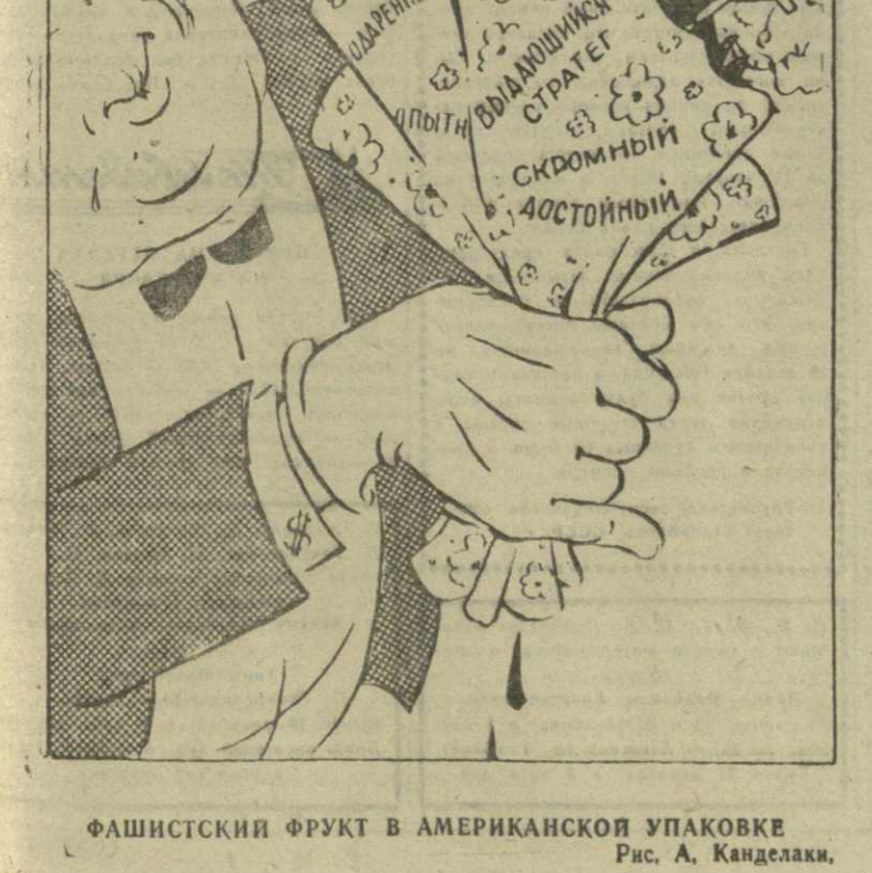
ФАШИСТСКИЙ ФРУКТ В АМЕРИКАНСКОЙ УПАКОВКЕ Рис. А. Канделаки.

Гитлеровский убийца Хойзингер изобличен неопровержимыми уликами. Но это не мешает долларовой прессе лгасловить нацистского преступника.