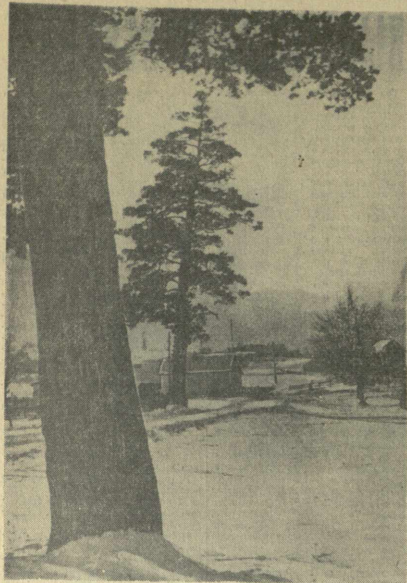
Первый снег — вестник зимы. На снимке: Сурами в снегу.