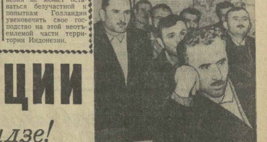
Механизаторы во время занятий в школе пер...

Ответ Сукарно на обращение Кеннеди НЬЮ-ЙОРК, 19 декабря. (ТАСС). По полученным здесь сведениям, президент Индонезии Сукарно информировал президента США Кеннеди, что Индонезия будет вынуждена применить силу для освобождения Западного Ириана от голландских колонизаторов, если последние не прекратят провокации против индонезийского народа. Сукарно, отвечая на призыв Кеннеди к мирному решению вопроса о Западном Ириане, предостерег, что Индонезия не может оставаться безучастной к попыткам Голландии увековечить свое господство на этой геостратегической части территории Индонезии.