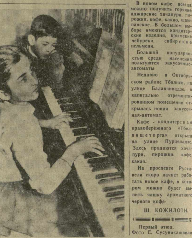
Первый этюд.

Неоновая реклама кафе «Мерзобро» появилась на площади Марджанишвили совсем недавно.