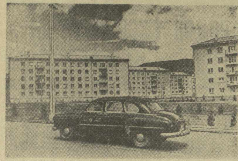
К празднику Первого мая в четвертом квартале Сабуртальского массива сданы в эксплуатацию два пятиэтажных жилых дома. На снимке: один из уголков IV квартала.