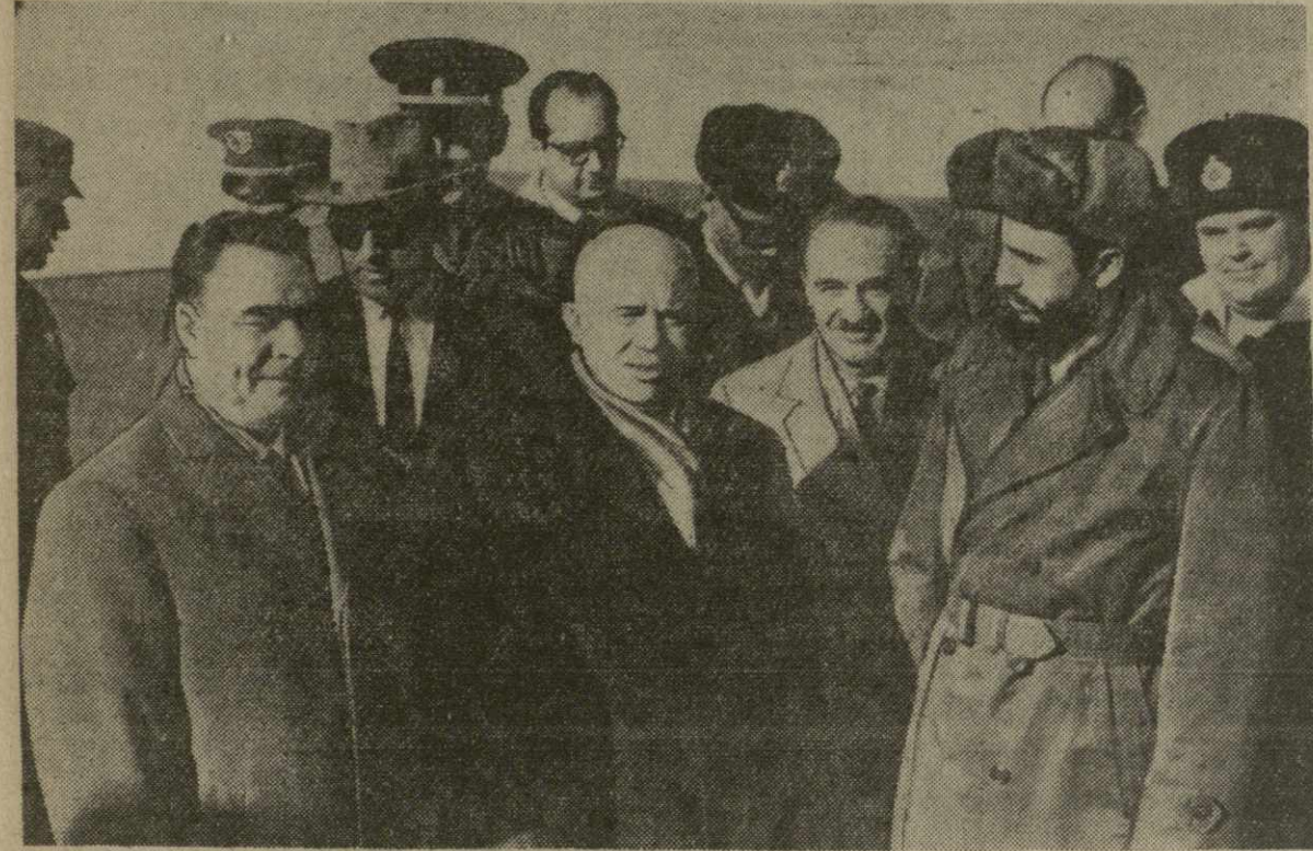
Прибытие в Москву первого секретаря Национального руководства Единой партии социалистической революции, Премьер-министра Революционного правительства Республики Куба Фиделя Кастро Руса.