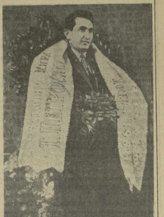
В Москве состоялся торжественное закрытие матча на звание чемпиона мира по шахматам. На снимке: чемпион мира Т. Петросян.

Как известно, на днях в Московском театре эстрады закончился матч по шахматам между выдающимся советским гроссмейстером Михаилом Ботвинником и Тиграном Петросяном.