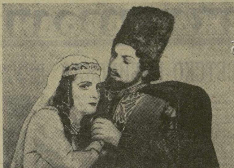
Жан Пирс в опере «Травняк»