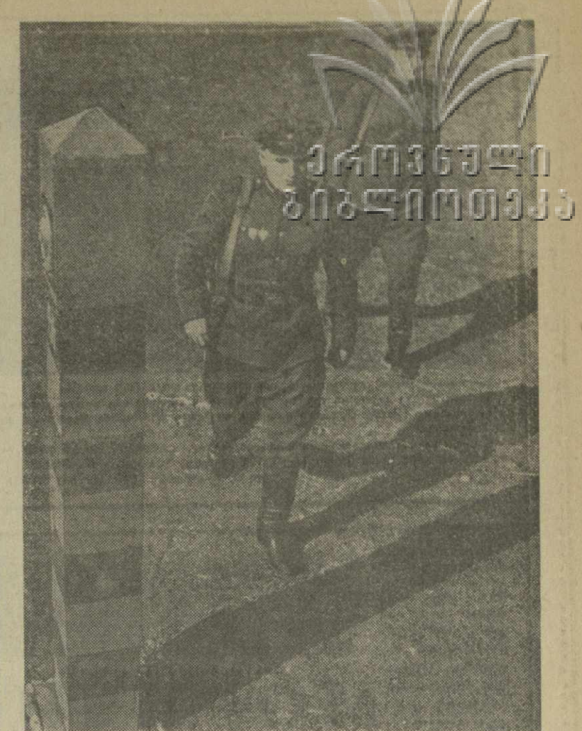
Здесь проходит Государственная граница. Воины Н-ской заставы зорко охраняют ее.

Странное, взволнованное слово писателя особенно необходимо нашей молодежи, которая ждет от писателя больших художественных открытий. Молодежь хочет видеть образец настоящего человека, ей нужен ге-