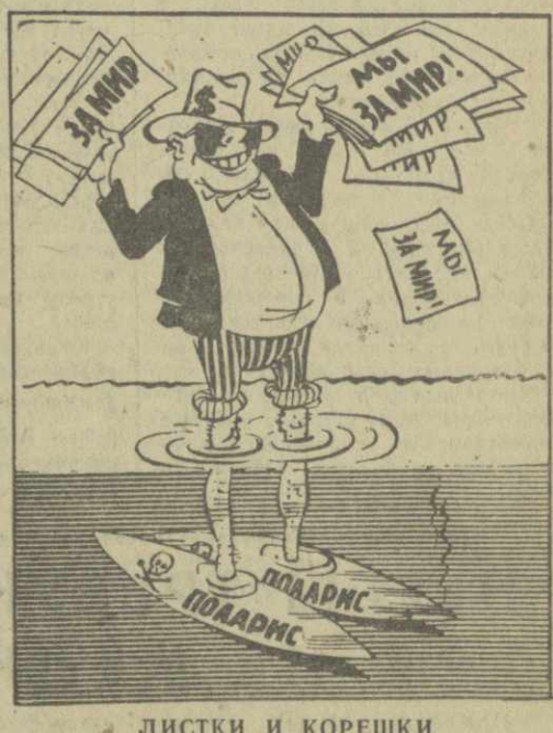
ЛИСТКИ И КОРЕШКИ. Рис. А. Кандолаки.

Выступая на словах за мир, заправили НАТО противники в районе Средиземного моря подводных лодок, оснащенных ракетами «Поларис». (Из газет).