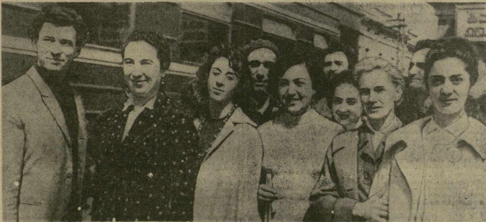
На снимке: группа артистов Ереванского Государственного ордена Ленина академического театра оперы и балета имени Ал. Спендиарова на перроне Тбилисского вокзала.

Вчера на гастроли в столицу Советской Грузии приехал коллектив Ереванского Государственного ордена Ленина академического театра оперы и балета имени Ал. Спендиарова.