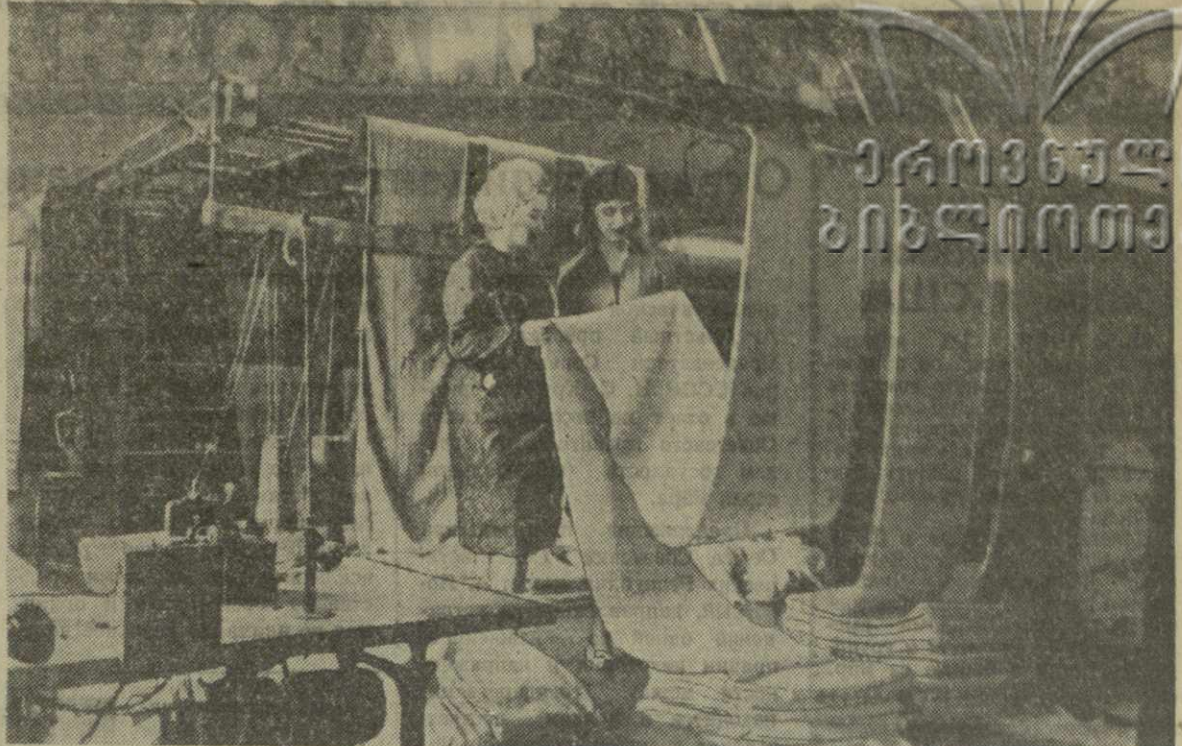
На днях красиво-отделочный цех тбилисской фабрики «Грузтрикотаж» разработал и внедрил в производство новые расцветки ворсовых полотен для детского верхнего трикотажа. Эту работу трикотажники провели в честь XXII съезда Компартии Грузии.

ЖУРНАЛ «САТЕРДЕН ИН-НИНГ ПОСТ». «Каждый год мы выбрасываем на свалку более миллиона молодых людей. Когда мы расточили природный газ, леса и плодородный покров почвы; сейчас мы расточаем самое ценное наше достояние — производственную силу молодых мозгов и мускулов творчески способной молодежи.