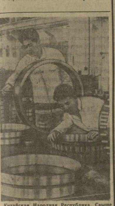
Китайская Народная Республика. Самые 800 различных видов подшипников выпускают заводы Шанхая. Высший диаметр самого большого подшипника, сделанного в Шанхае, — 1,7 метра, самые маленькие — с внутренним диаметром в один миллиметр. На снимке: сборка крупногабаритных подшипников на шанхайском подшипниковом заводе.

В каждом болгарском сердце горит любовь к великой братской Советской стране, к ее славной Коммунистической партии. Нет болгарского патриота, который не был бы твердо убежден, что братская дружба и нерушимое единство с Советским Союзом являются самой прочной гарантией свободы и независимости нашей страны, успешного ее развития по пути социализма, сохранения и укрепления мира на Балканах и в Европе. В передовой, озаглавленной «Волнующая радость», газета «Отечественный фронт» отмечает, что вест о предстоящем визите советской партийно-правительственной делегации в Болгарию долетела до всех уголков республики и наполнила сердца людей радостью и счастьем. Прибытие советской партийно-