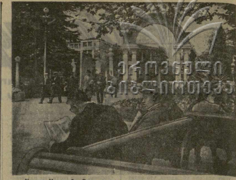
Курорт Тсалугбо. Один из уголков парка культуры и отдыха.

Вчера в Тбилиси в кинотеатре «Спартак» открылся фестиваль кинофильмов, посвященный дружбе народов братских республик Закавказья.