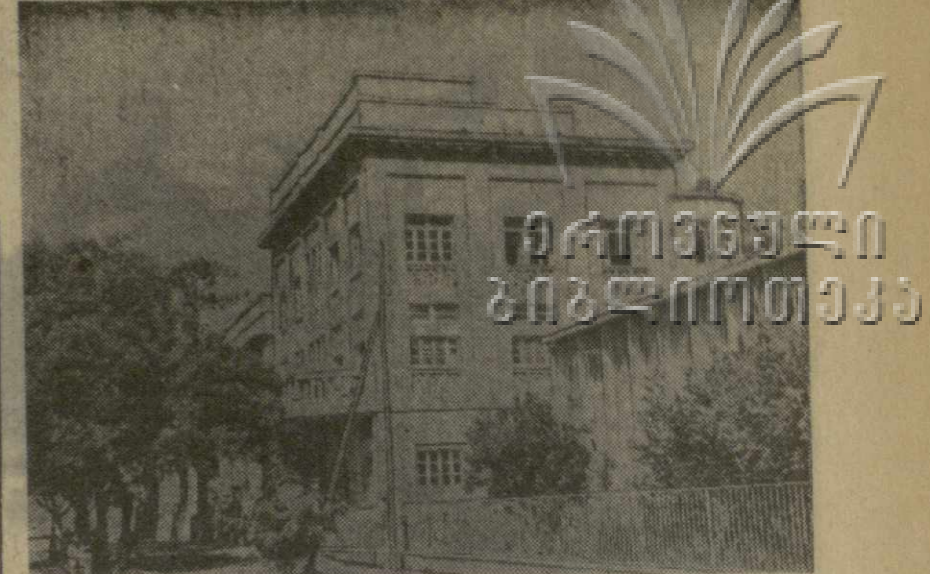
В Аддис-Абебе хорошо знают советских врачей. Много лет в Аддис-Абебе они ведут прием в больнице Советского Красного Креста. Специалисты оказывают бесплатную лечебную помощь населению. В больнице повышают свою квалификацию местные медики. На снимке: здание советской больницы.