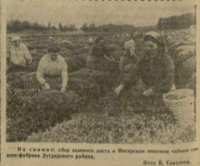
На снимке: сбор зеленого листа в Ингирском опытном чайном совхозе-фабрике Зугдидского района.