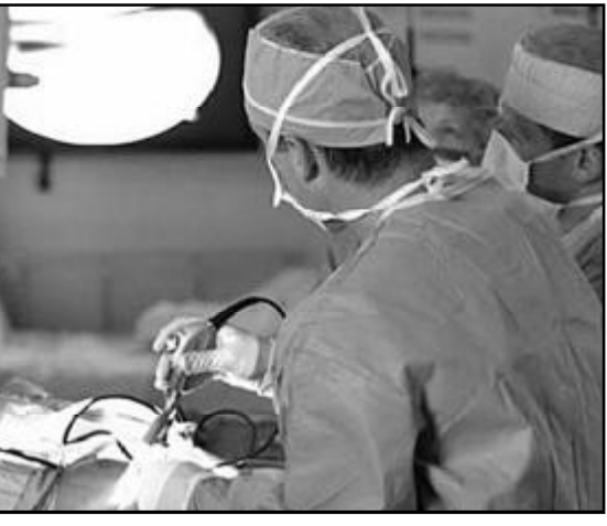
ვაზე, რომელსაც ექიმები ყოველდღიურად ხედავენ. ფსიქოლოგები ამტკიცებენ, რომ თუ ექიმის ცხოვრებაში რაიმე პირადი ტრაგედია მოხდება, ისინი ამას მშვიდი გულგრილობით შეხვდებიან, რაც ფსიქოლოგთა განმარტებით ფსიქოლოგიური პრობლემების ნიშანია.

იურიტი - ამ პროფესიის ადამიანებს ადვილად გამოარჩევთ ხალხის ტალღაში, მკაცრი კოსტიუმი, ხელში ქეისი, კონსერვატული ვარცხნილობა, თუმცა, ეს მხოლოდ გარეგნული მაჩვენებლებია.