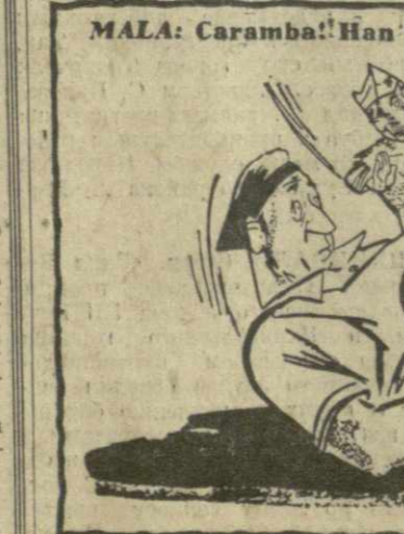
Франко и Салазар (друг другу): «Чорт возьми! Он поднимается!»