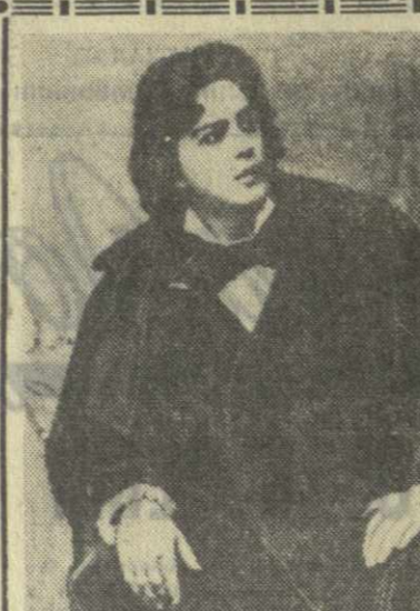
Л. В. Собинов в роли Ленского.