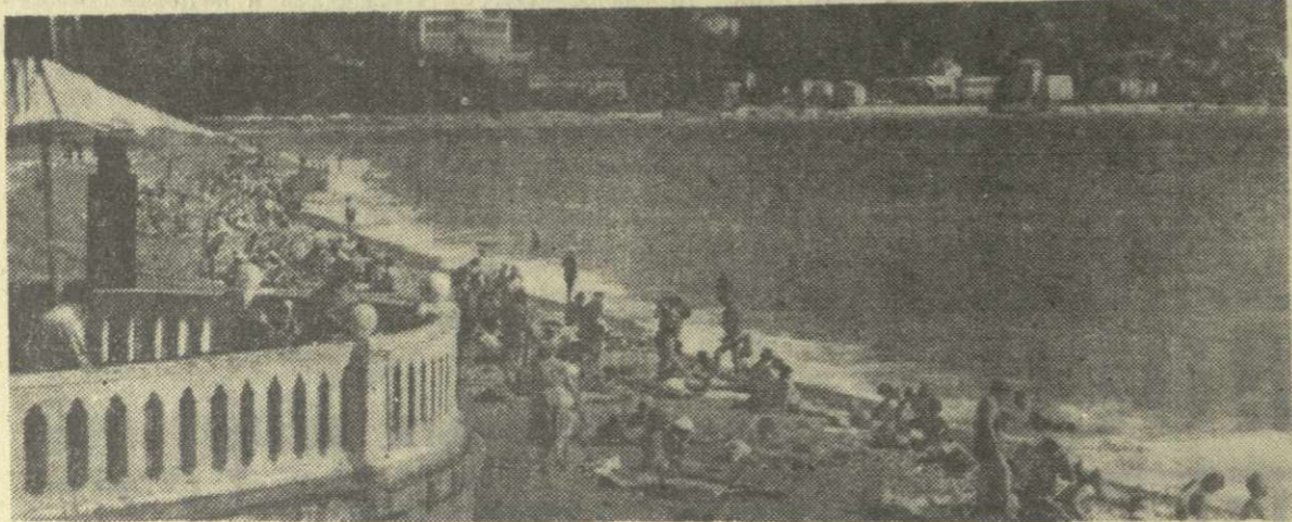
На пляже.