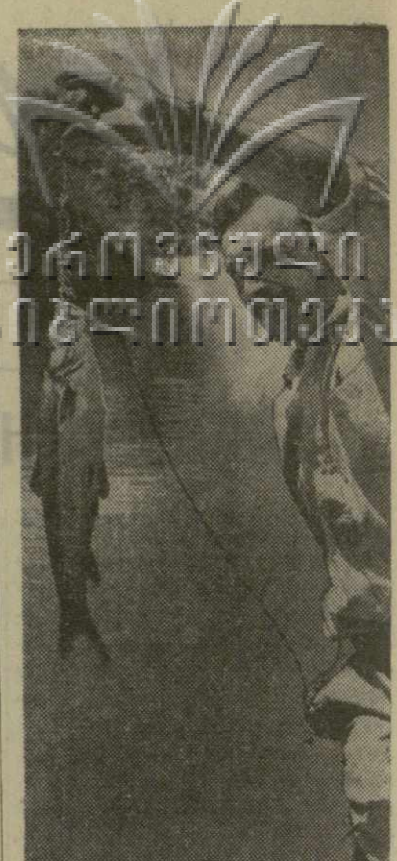
На рыбалке. Фото Г. Вахтангадзе.

Воскресенье. В этот день досуга каждого тает к любимому занятию. Любителей - рыболовов, как всегда, можно застать у воды. Уже в субботу начинаются хлопотливые сборы: приводятся в порядок удочки, готовятся насадка и рыболовное снаряжение. А утром, когда чуть забрезжит рассвет, рыбак уже у воды. Рыболова - любителя можно встретить на Куре и на Алазани, на озере Лиси и на Храми - всюду, где есть возможность закинуть удочку. С удочкой у реки — это чудесный отдых! На снимке: рыболов-любитель. Фото Г. Вахтангадзе.