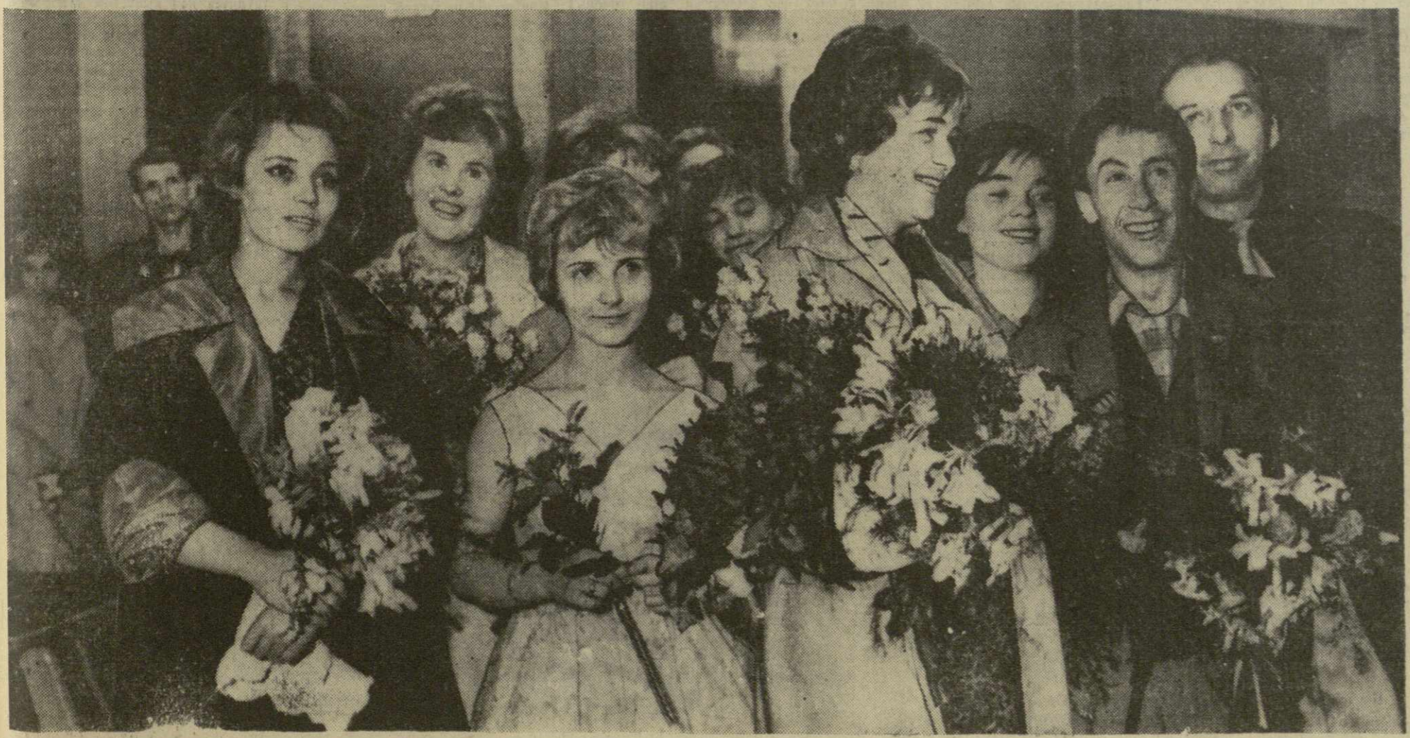
Московский театр «Современник» в Тбилиси. На снимке: встреча в аэропорту.

Встречать гостей пришли министр культуры Грузинской ССР Т. Буачидзе, его заместитель А. Двалишвили, видные актеры, режиссеры, представители театральной общественности Тбилиси, деятели литературы и искусства. Среди встречающих немало знакомых и друзей «современников». И, конечно, на аэродроме был режиссер Г. Лордкипанидзе. Ведь он, так же как и художник Д. Такашвили, больше всех «породнился» с «Современником»: первый поставил в театре «Пятую колонну» Э. Хемингуэя, а второй оформил этот спектакль. С теплой приветственной речью обратился к коллективу театра «Современник» главный режиссер театра имени Руставели народный артист Грузинской ССР Д. Алексидзе.