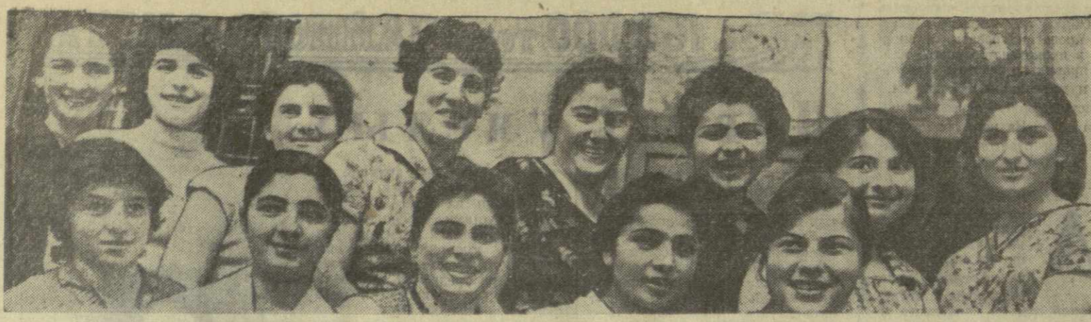
В ноябре 1961 года из Казбегского района приехали на Тбилисский камвольно-суконный комбинат 50 девушек, которые теперь успешно работают прядильщицами и ткачихами. На снимке: группа ткачих и прядильщиц из Казбегского района.