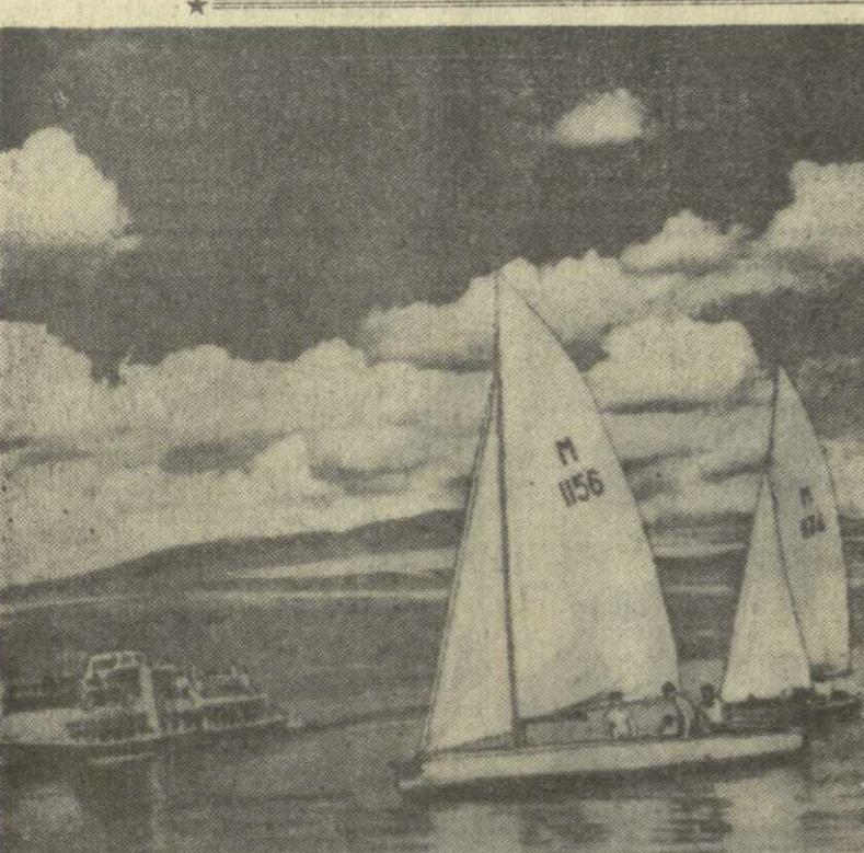
На Тбилисском море.

Команда «Буревестника» проведет в Польше еще три игры.