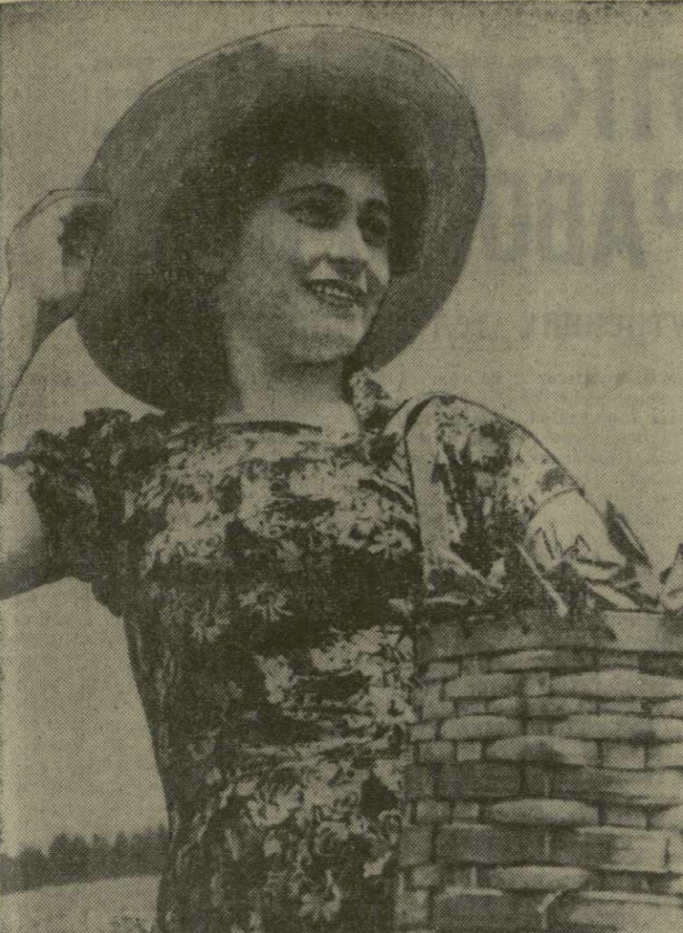
Успешно идет сбор сырья в Оваришском чайном совхозе Зугдидского производственного управления. При плане 740 тонн оваришские обязались собрать и сдать государству 790 тонн «зеленого золота».