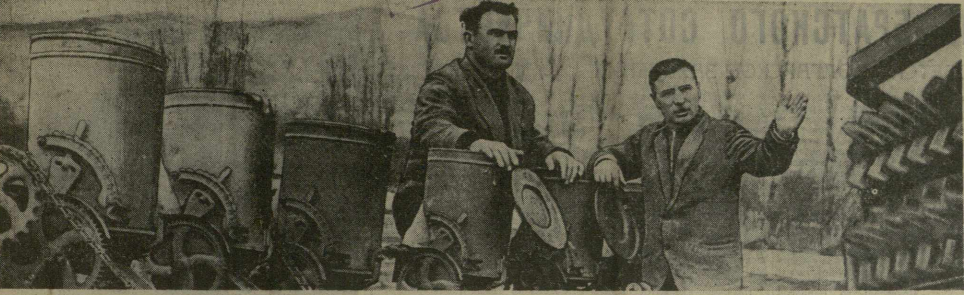
Свыше 1.000 тонн азотистых, калийных и фосфорных удобрений будет внесено в этом году на 2.000 гектарах посевной площади колхоза имени Калинина села Базалети Душетского производственного управления.

ПARIЖ, 21 февраля. (ТАСС). Агентство Франс Пресс сообщает, что сегодня утром было совершено покушение на премьер-министра Турции Инению. Покушавшийся, пытавшийся застрелить Инению, арестован. Премьер-министр остался невредим.