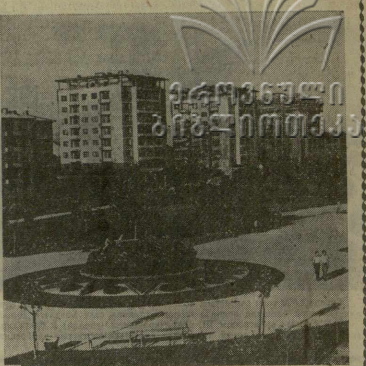
Братский болгарский народ, за короткий срок осуществив коренные революционные преобразования в своей стране, превратил ее в социалистическое государство. С каждым годом повышается материальный и культурный уровень трудящихся Болгарии, крепнет ее хозяйство, хорошеют ее города. На снимке: жилой комплекс имени В. Займова в Софии.

новки, коллективно выработанные братскими марксистско-ленинскими партиями мира. КПСС и ВКП считают, что интерес дела мира и социализма требуют усиления борьбы всех марксистско-ленинских партий за укрепление единства и сплоченности международного коммунистического движения на основе генеральной линии, определенной Декларацией и Заявлением Московских совещаний. Обе партии подчеркивают, что эта задача сегодня важна, как никогда ранее. Они решительно осуждают всякие попытки вести фракционную деятельность в рядах мирового коммунистического движения. Коммунисты и все трудящиеся Советского Союза и Болгарии, говорится в заключении совместного советско-болгарского заявления, уверены в том, что дальнейшее развитие и укрепление всестороннего братского сотрудничества между двумя странами полностью отвечают коренным интересам советского и болгарского народов, способствуют успешному решению исторической задачи — построению коммунистического общества в обеих странах и укреплению дела социализма во всем мире. (ТАСС).