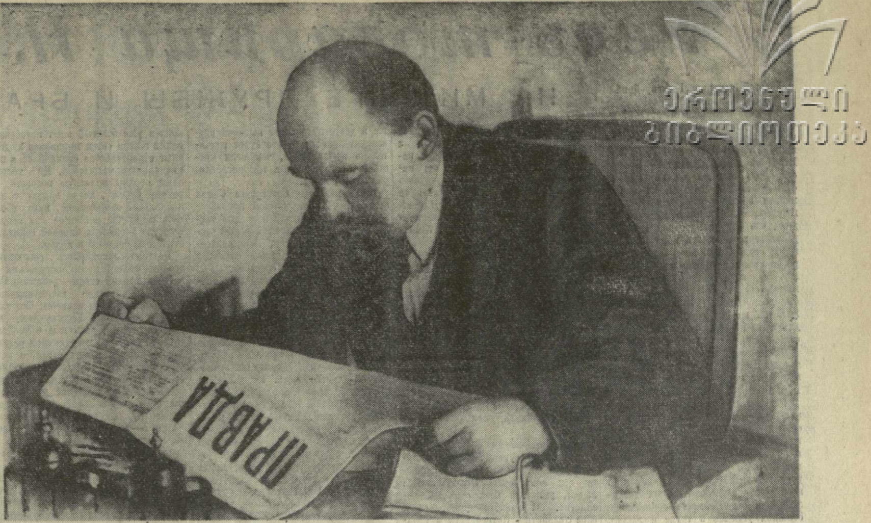
Владимир Ильич Ленин читает «Правду».

Борт самолета «ИЛ-18», 25 июня 1962 года.