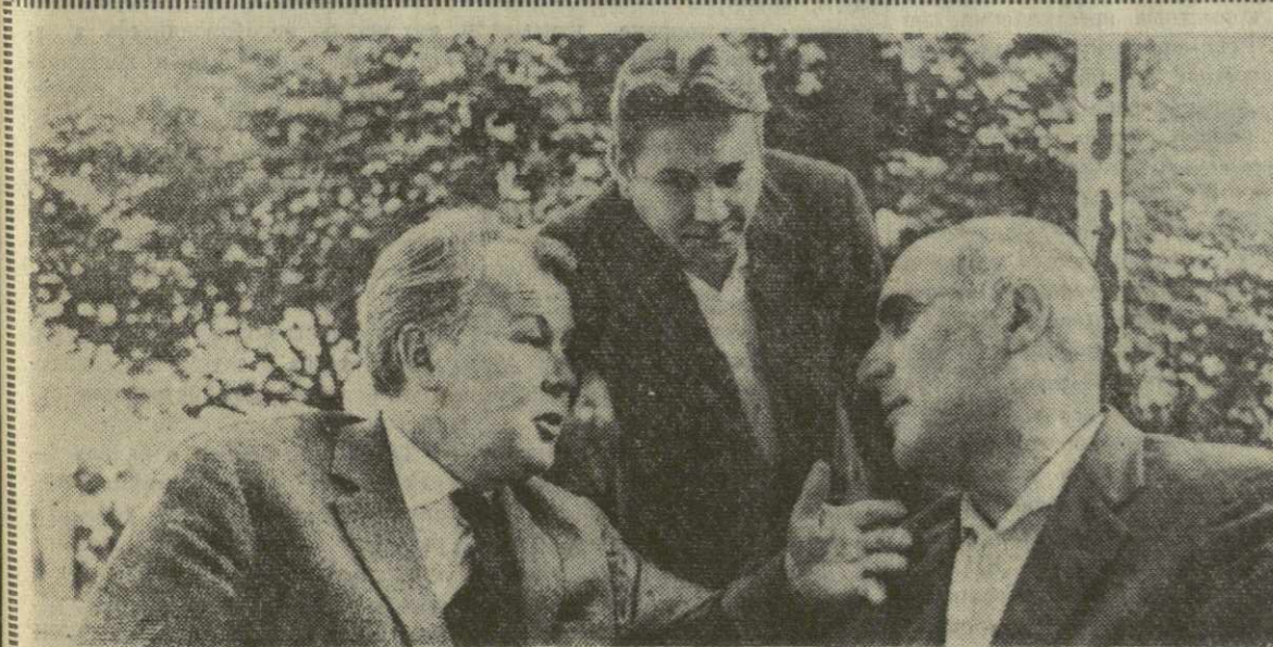
На снимке (слева направо): А. Твардовский, Н. Доризо, И. Абшидзе.

Коллектив Закавказской железной дороги, широко развернув социалистическое соревнование за успешное выполнение заданий семилетки, добился нового крупного успеха. Он досрочно, на 7 дней раньше срока, реализовал полугодовой план погрузки. До конца полугодия железнодорожники обязаны погрузить сверх плана 500 тысяч тонн народнохозяйственных грузов. (ГрузТАГ).