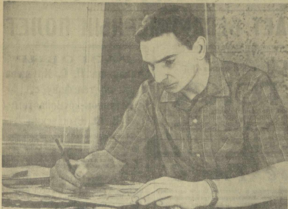
Валерий Федорович Быковский в своем рабочем кабинете.

И снова советский человек в космосе! Снова по неперотренным звездным дорогам Вселенной летит могучий космический корабль — символ торжества советской науки, творения наших ученых, инженеров, техников, рабочих.