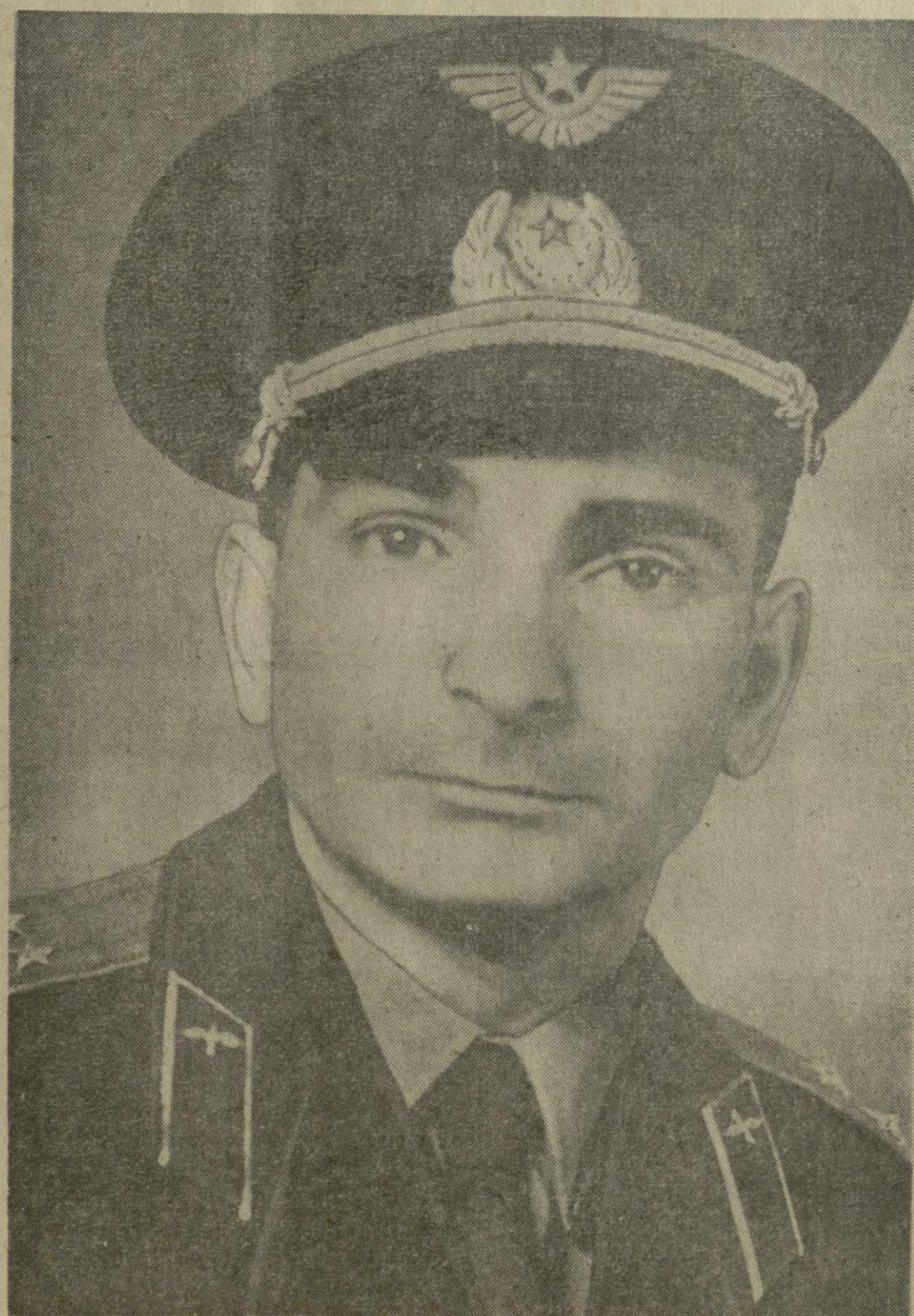
ВАЛЕРИЙ ФЕДОРОВИЧ БЫКОВСКИЙ.

14 июня Первый секретарь Центрального Комитета КПСС, Председатель Совета Министров СССР Н. С. Хрущев принял лидера лейбористской партии Англии Гарольда Вильсона и имел с ним беседу, которая прошла в дружественной обстановке.