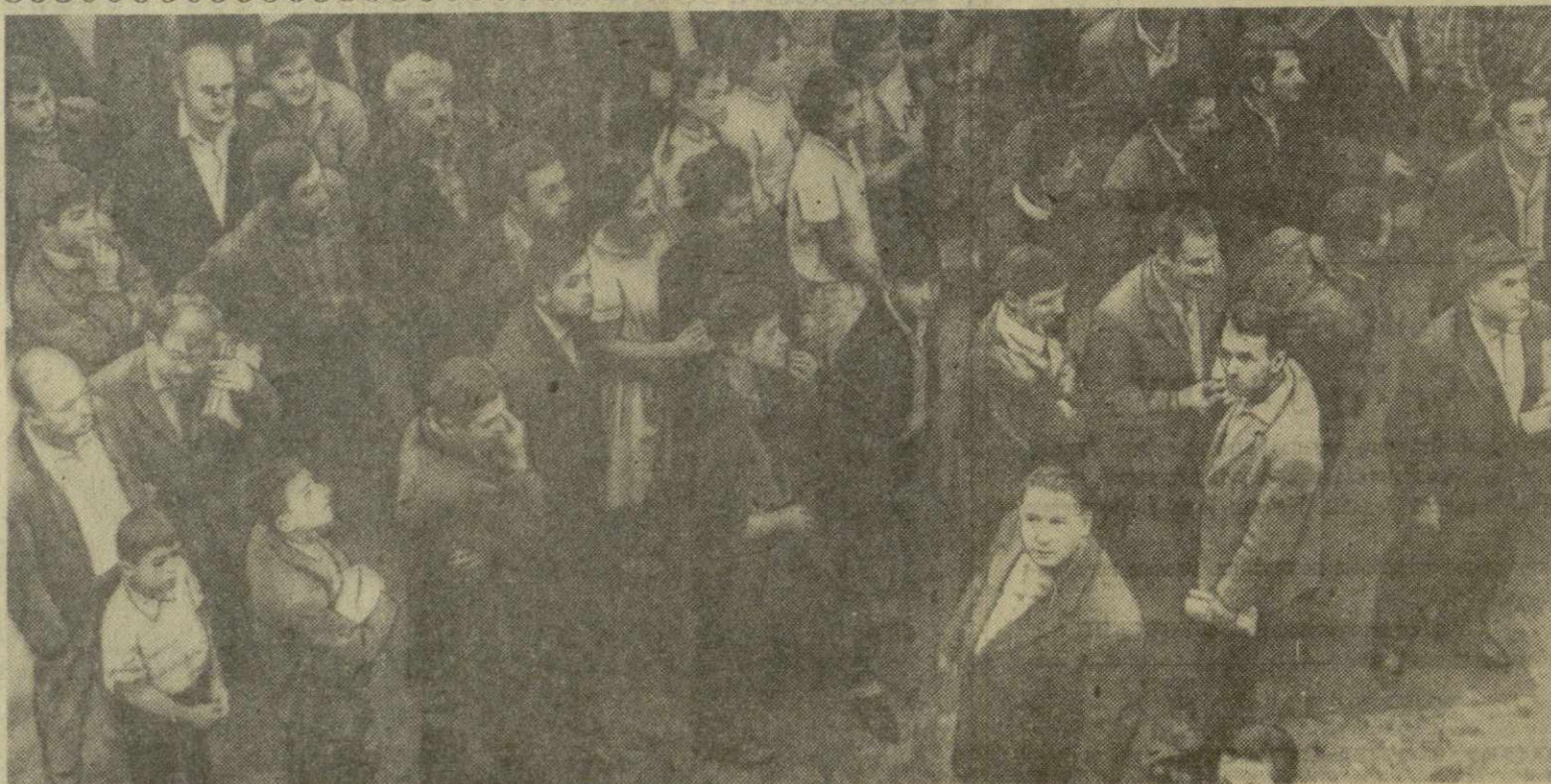
В космосе — корабль «Восток-5», лётчик-космонавт Валерий Федорович Быковский. С чувством глубокого восхищения новым подвигом советской науки слушают тбилисцы передачу о полете космического корабля-спутника.