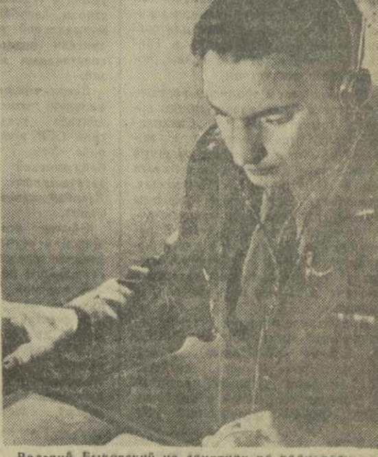
Валерий Быковский на занятиях по радиоделу.