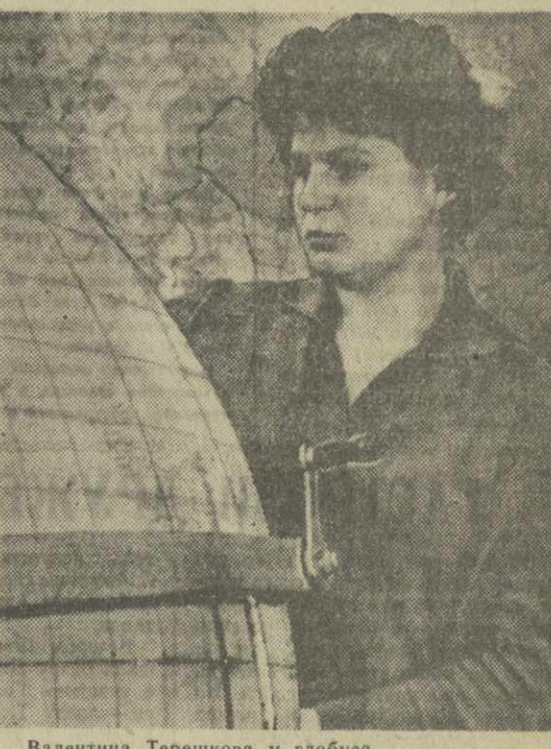
Валентина Терешкова у глобуса.