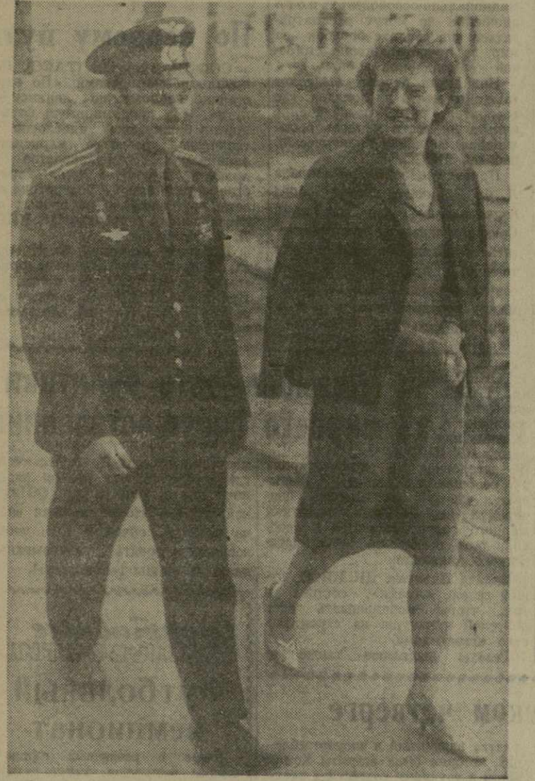
Пионеры космоса — советский гражданин Юрий Алексеевич Гагарин, первым в мире поднявшийся в звездные дали, и Валентина Владимировна Терешкова, гражданка Советского Союза — первая в мире женщина, взглянувшая на Землю с космической высоты.