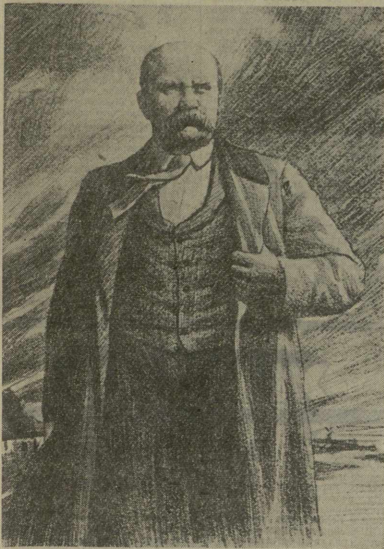
Т. Г. ШЕВЧЕНКО Рисунок художника Т. Бардадзе.

«Он — поэт совершенно народный... Весь круг его дум и сочувствий находится в совершенном соответствии со смыслом и строем народной жизни. Он вышел из народа, жил с народом, и не только мыслью, но обстоятельствами жизни был с ним крепко и кровно связан». Эти слова Добролюбова можно поставить эпиграфом ко всему творчеству Тараса Григорьевича Шевченко — великого украинского кобзаря, прошедшего славный путь борца за народное счастье.