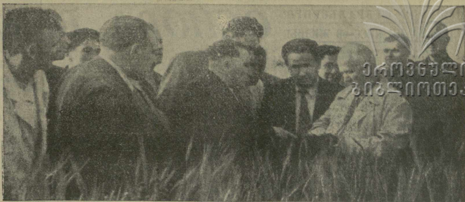
Никита Сергеевич Хрущев в совхозе имени дважды Героя Советского Союза И. Павлова Кустанайской области. (1956 год).

Сегодня в Тбилиси открывается пленум ЦК КП Грузии, который обсудит итоги февральского пленума ЦК КПСС и определит практические меры по успешному выполнению намеченной партией программы интенсификации сельскохозяйственного производства в Грузии. Трудящиеся Советской Грузии не пожалеют сил для того, чтобы осуществить великие предначертания ленинской партии.