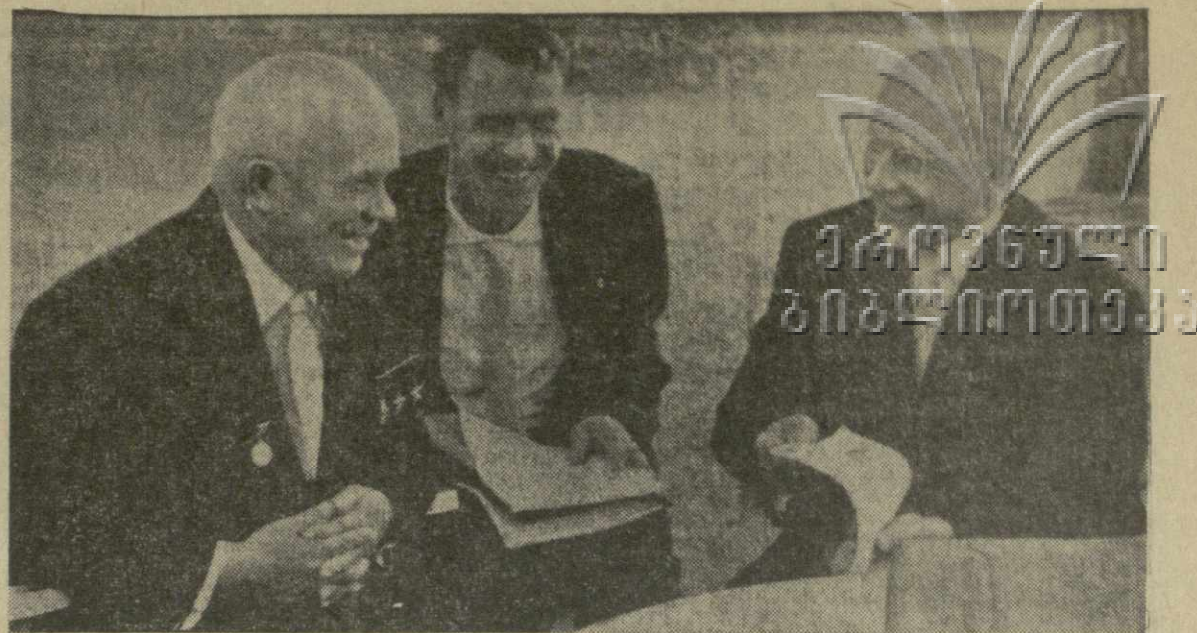
В Берлине состоялся большой торжественный прием по случаю 70-летия со дня рождения Вальтера Ульбрихта. Гостями ГДР горячо встретили прибывшего на торжество Первого секретаря ЦК КПСС, Председателя Совета Министров СССР Н. С. Хрущева. На снимке: Н. С. Хрущев беседует с Вальтером Ульбрихтом.

бу за досрочное выполнение заданий пятого года пятилетки и взятых социалистических обязательств.