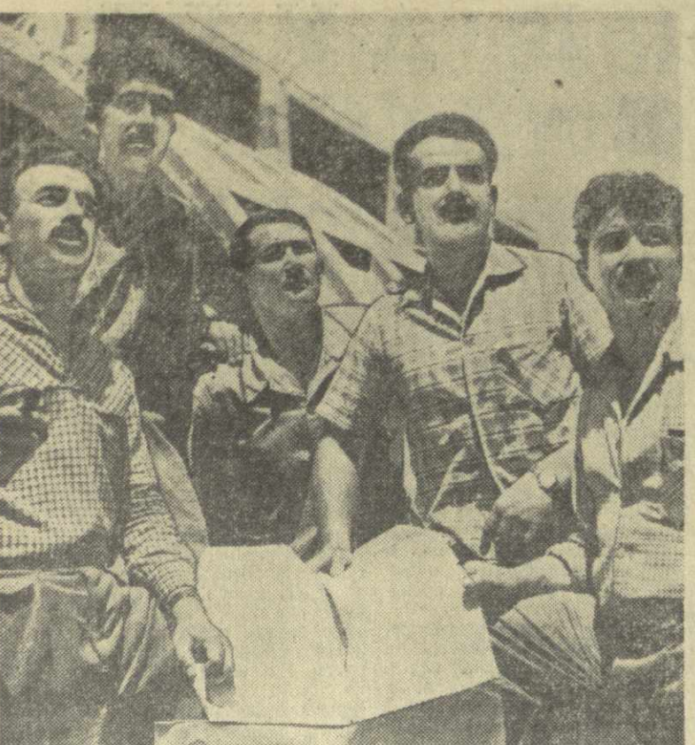
Осеню нынешнего года даст ток первый турбогенератор крупнейшей стройки семилетки республики — Тбилисской ГРЭС...