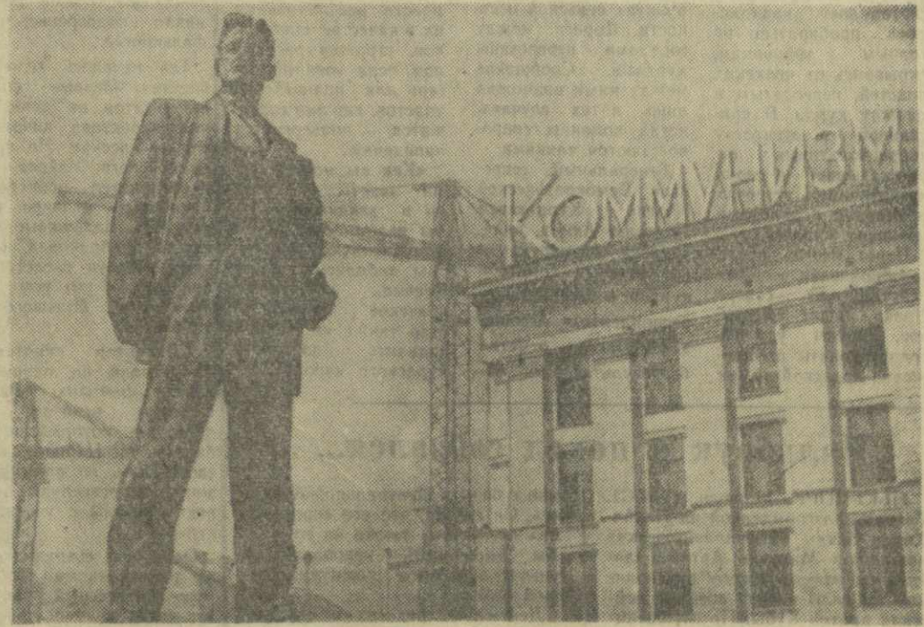
На снимке: памятник в Москве великому советскому поэту В. В. Маяковскому.