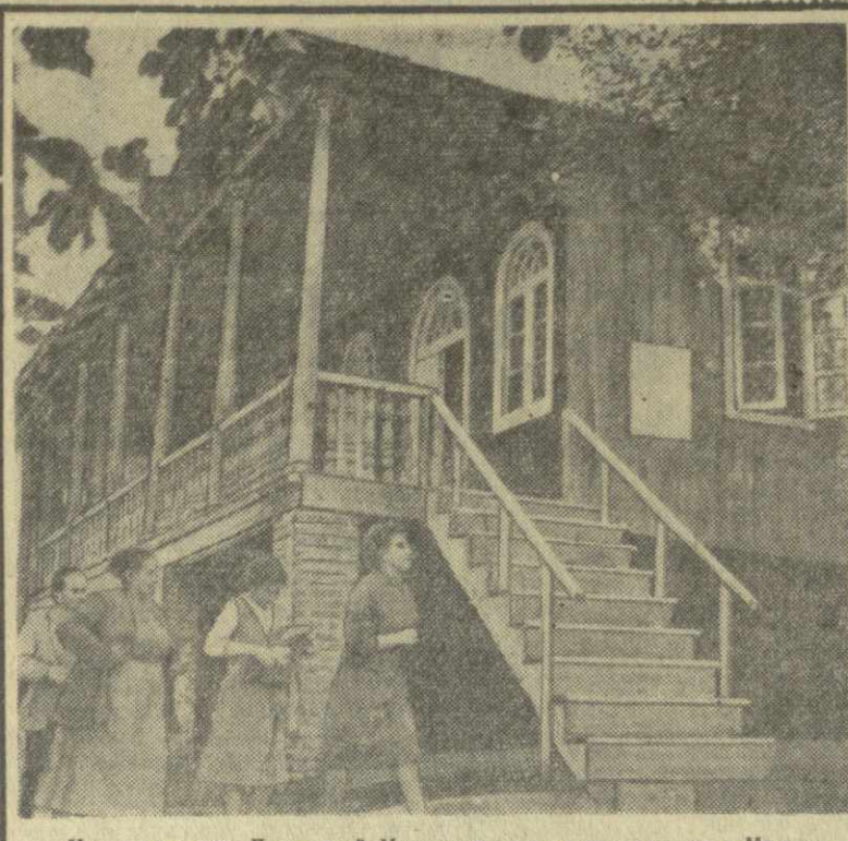
На снимке: Дом-музей Маяковского на родине поэта в Магковски.

...Много, много мыслей и чувств вызывает у человека дом на берегу бурной Хансикхали, как и книги поэта, родившегося в этом доме.