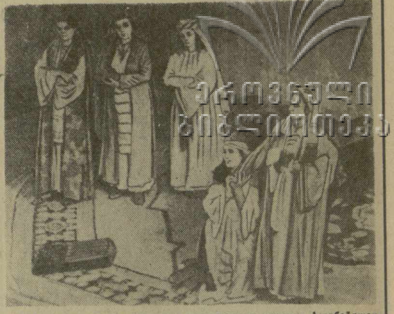
С большим успехом проходят в нашем городе гастроли Азербайджанского государственного театра оперы и балета имени Мирзы Фатали Ахундова...