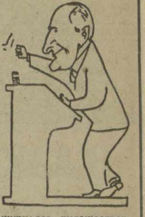
Журналов, художественных советов театров, различных творческих организаций республики...

Мы заинтересовались, с какими творческими планами встречается Б. Жгенти свое 60-летие.