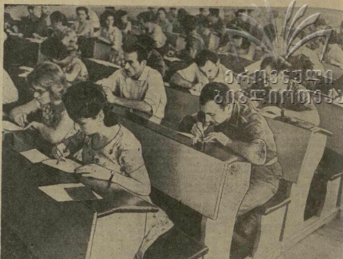
На снимке: письменные экзамены по грузинскому языку и литературе в Тбилиском государственном университете.

По предварительным данным Бюро погоды, в ближайшие дни по всей Грузии ожидается постепенное незначительное повышение температуры, но уже такой жары, какая наблюдалась в конце июля, не будет.