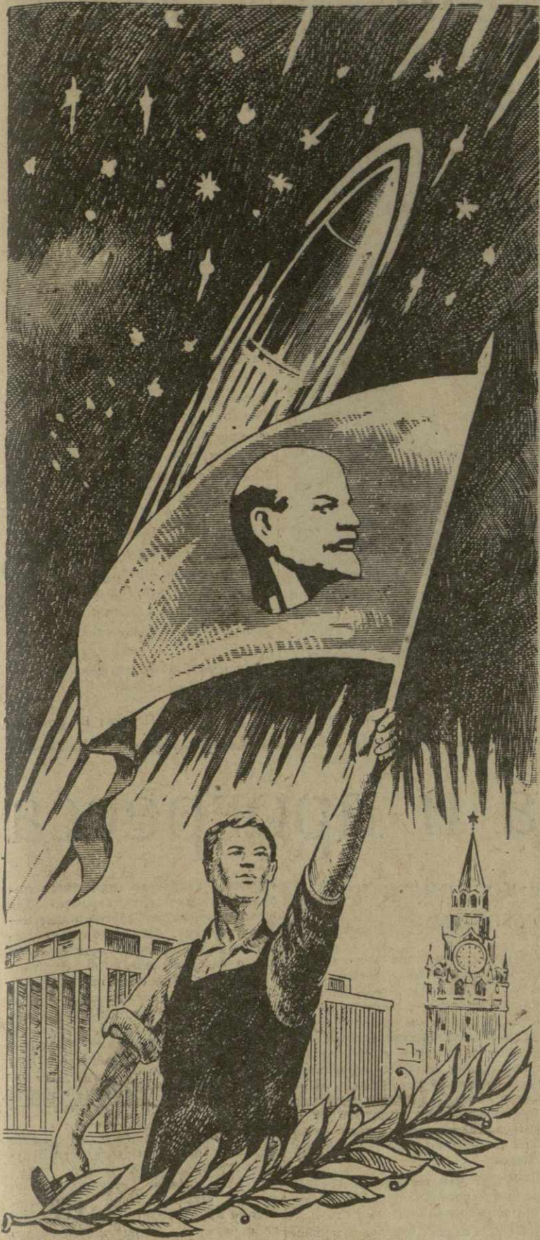
Рис. С. Ботковели.

Так славься, человечества весна. И этот день, и подвиг дерзновенный, И мощь социализма, что видна Далеким звездам в глубине Вселенной.