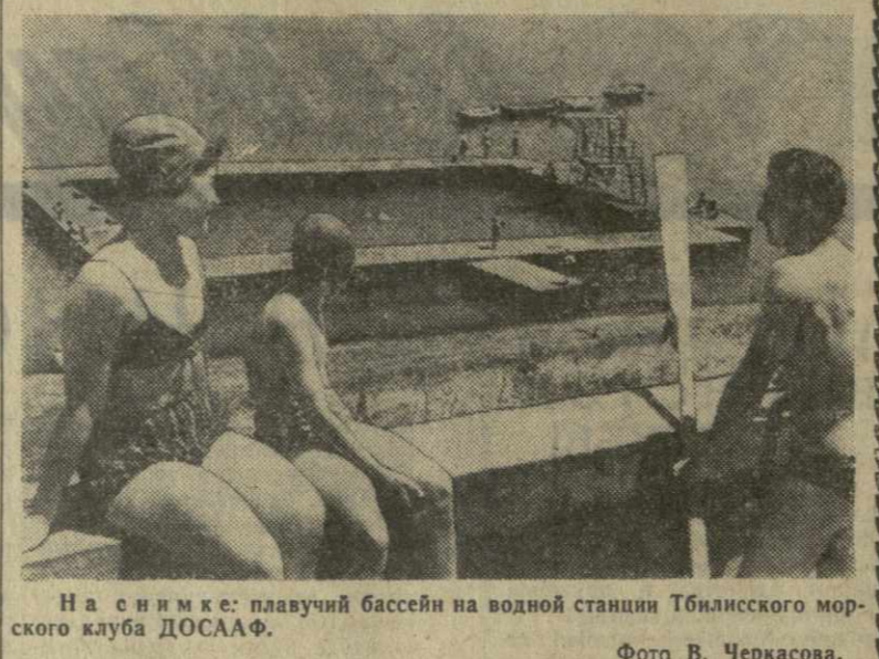
На снимке: плавучий бассейн на водной станции Тбилисского морского клуба ДОСААФ.