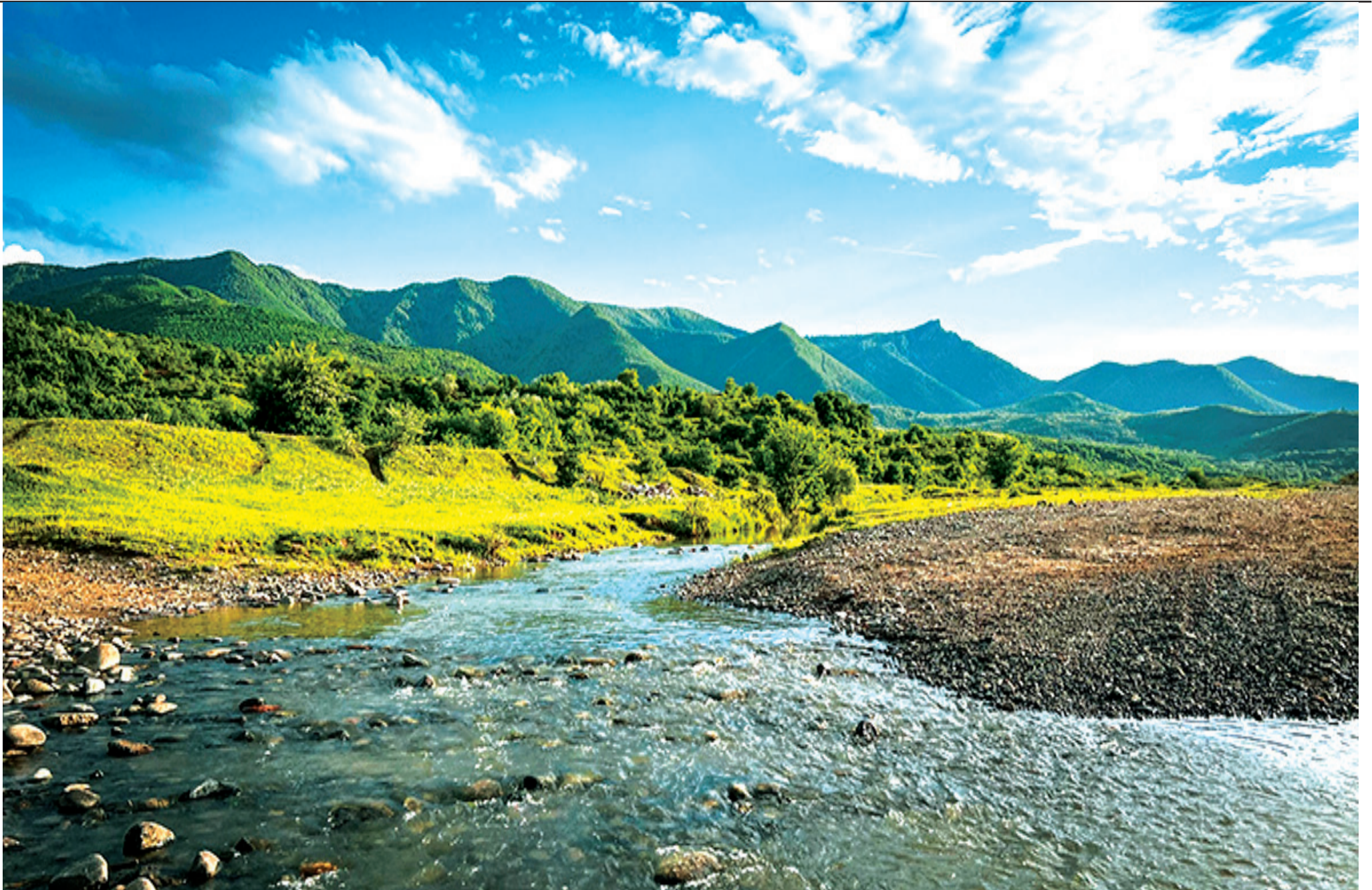
თრიალეთის ქედი, რომელიც სამხრეთიდან აკრავს ჩვენს მუნიციპალიტეტს, წლის ნებისმიერ დროს ულამაზესია.