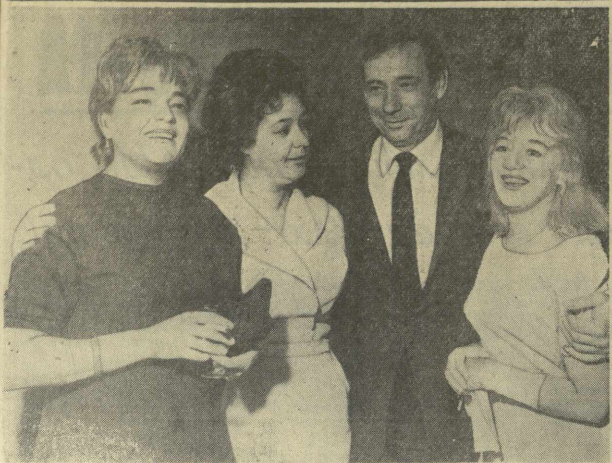
3-й Московский международный кинофестиваль. Известные французские киноактеры Ив Монтан и Симо-на Синьоре (слева) с советскими актрисами Людмилой Шагаловой (справа) и Мариной Стриженовой.

Флаг фестиваля спущен. Заучит Гимн Советского Союза — гимн страны кинофестиваля, девиз которого «За гуманизм киноискусства, за мир и дружбу между народами».