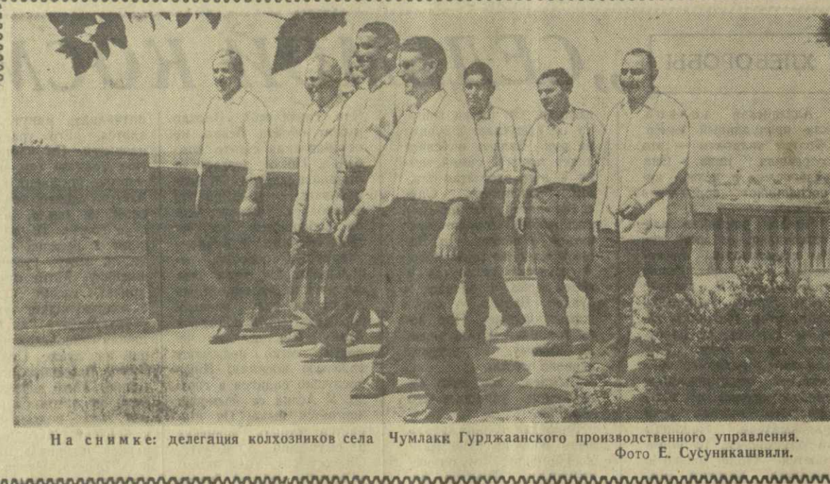
На снимке: делегация колхозников села Чумлаки Гурджаанского производственного управления.