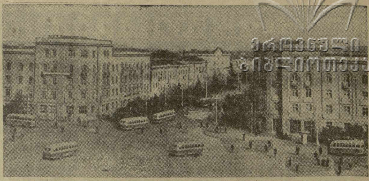
На снимке: один из уголков сегодняшнего Рустави.

Коллективный корреспондент «Зари Востока» — редакция газеты «Социалистическая Рустави».