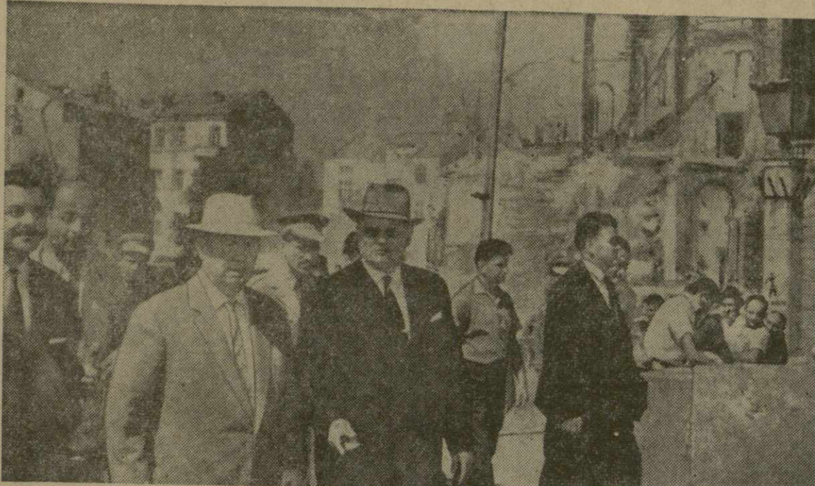
Находящийся в Югославии Первый секретарь ЦК КПСС, Председатель Совета Министров СССР Н. С. Хрущев вместе с генеральным секретарем Союза коммунистов Югославии, президентом СФРЮ Йосипом Броз Тито осматривает город Скопье, пострадавший от землетрясения 26 июля. На снимке: Н. С. Хрущев и Йосип Броз Тито в Скопье. (Принято по фототелеграфу).