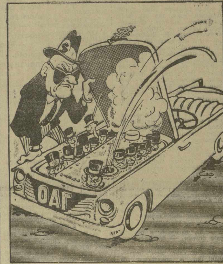
ОДИН ЦИЛИНДР ОТКАЗАЛ... Рис. А. Канделаки.

Бухарест, 27 августа. (ТАСС). Советские представители прибыли на Галацкий судовой построенный по заказу Советского Союза морской теплоход «Новый Донбасс». Производство морских теплоходов налажено в стране в годы народной власти. «Новый Донбасс» — первое судно такого типа, сделанное галацкими судостроителями на экспорт.