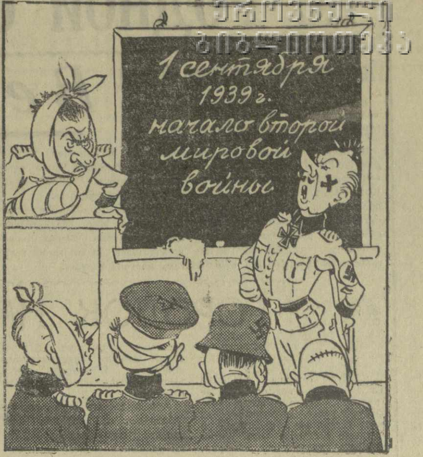
УРОК, НЕ ПОШЕДШИЙ ВПРОК Рис. А. Канделаки.

В связи с годовщиной начала второй мировой войны японские фашисты устраивают реваншистские сборища. (Из газет)