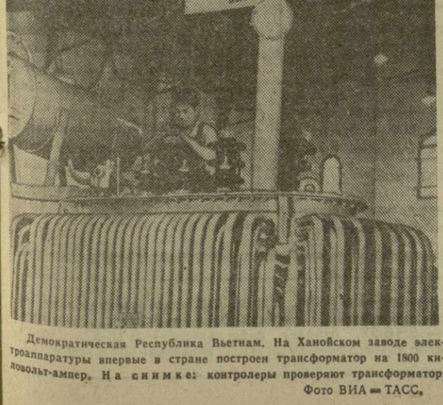
Демократическая Республика Вьетнам. На Ханойском заводе электротехники впервые в стране построен трансформатор на 1800 киловатт-ампер. На снимке: контролеры проверяют трансформатор.

Именно это обстоятельство заставило «бешеных» в США изменить свою тактику. Теперь они выступают не столько против ратификации этого Договора, сколько добиваются того, чтобы это не привело к но-