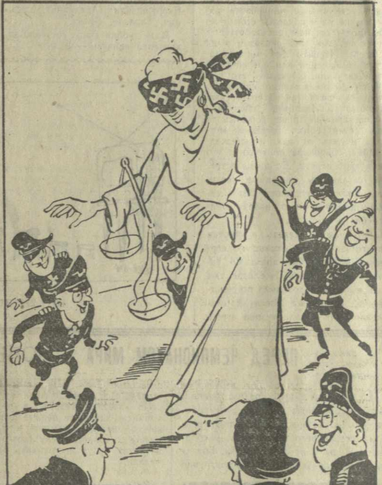
БОННСКАЯ ФЕМИДА ЗА РАБОТОЙ... Рис. А. Канделаки.

Выступающие отметили, что, воспитанный на традициях грузинского театрального искусства, Д. Тавадзе проявил себя как самобытный, обладающий собственной манерой художник. Около 40 лет творческой деятельности послужило художнику театру. За этот период он оформил более 125 спектаклей театра имени Руставели, работал со многими выдающимися грузинскими режиссерами. (ГрузТАГ).