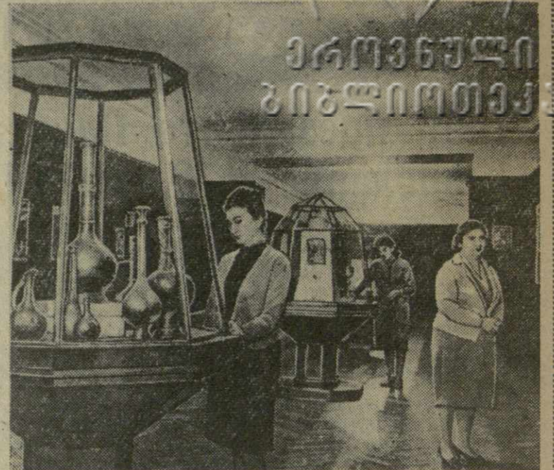
Государственный музей искусств Грузии. На снимке: осмотр особой кладовой музея.

Ш. АМИРАНАШВИЛИ, член-корреспондент Академии наук СССР, академик Академии наук Грузинской ССР.