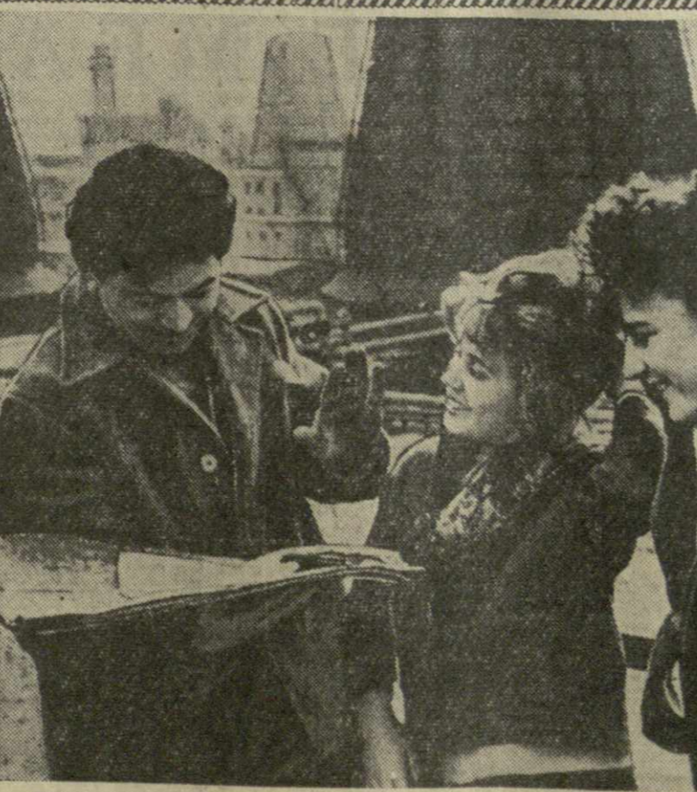
Хорошо трудится в эти дни коллектив Руставского азототукового завода — инициатор соревнования в честь 94-й годовщины со дня рождения В. И. Ленина. Среди маяков этого крупного объекта большой химии ленинскую трудовую вахту.