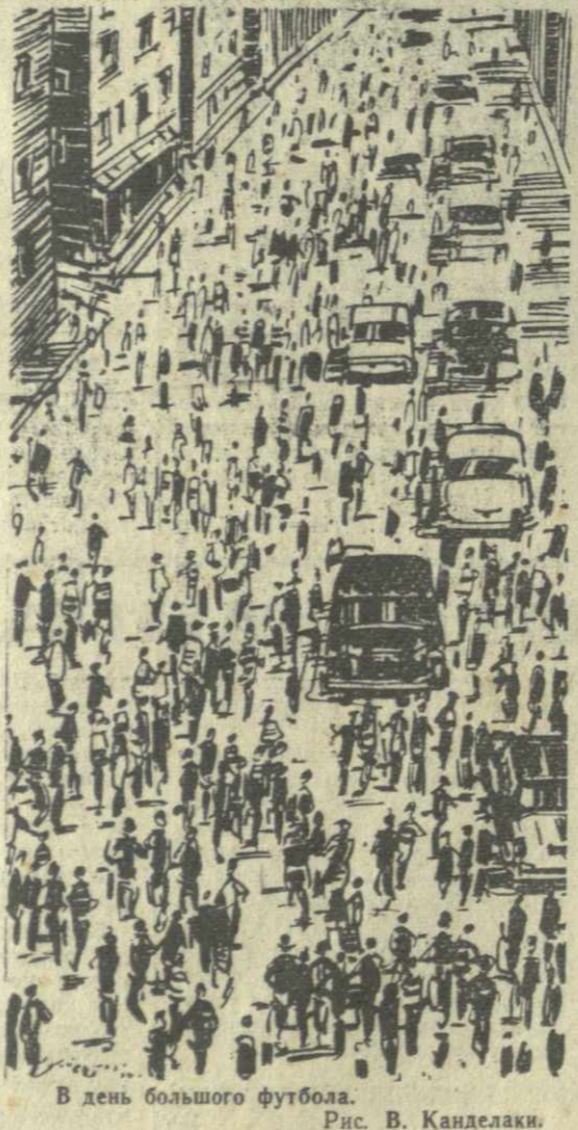
В день большого футбола. Рис. В. Канделаки.

Б. Гургенидзе и А. Бокучава завоевали право выступать в полуфинале очередного первенства СССР.