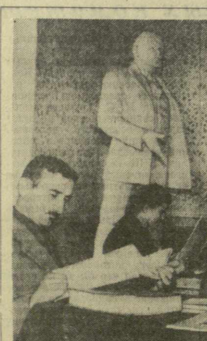
В библиотеке колхоза «Сакартвело» Очамчирского района организована выставка материалов о жизни и деятельности В. И. Ленина.

Другие документы рассказывают о том, как капиталистические страны, убедившись в бесплодности усилий расправиться с Советской Россией силой оружия и задумав ее экономическую блокаду, начали устанавливать с молодым Советским государством экономические связи. Осенью 1920 года представители итальянских и французских деловых кругов предложи-