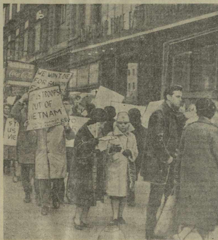
Планы продолжения и расширения «грязной войны» США в Южном Вьетнаме вызывают растущее сопротивление рядовых американцев. На днях в Нью-Йорке состоялась демонстрация протеста. Ее участники пикетировали призывный пункт на углу 14-й улицы и 5-й авеню. На снимке: демонстранты у призывного пункта.

НЬЮ-ЙОРК, 13 апреля. (ТАСС). Сегодня в Маниле открылась сессия совета военного блока в Юго-Восточной Азии СЕАТО, в которой участвуют представители США, Франции и ряда других стран. На сессии в качестве наблюдателя присутствует и министр иностранных дел Южного Вьетнама. По сообщениям иностранных агентств, южновьетнамский представитель намерен поставить перед участниками сессии вопрос об оказании помощи военной хунте в подавлении освободительной борьбы южновьетнамского народа.