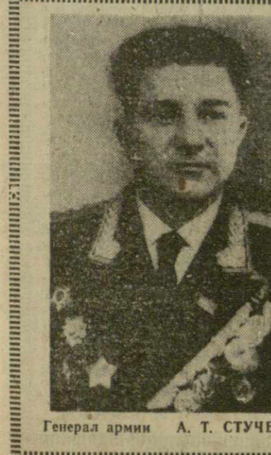
Генерал армии А. Т. СТУЧЕНКО.

ПАРИЖ, 27 апреля. (ТАСС). Муниципальный совет парижского пригорода Видьенноф решил переименовать одну из улиц города и присвоить ей имя советского космонавта Юрия Гагарина.