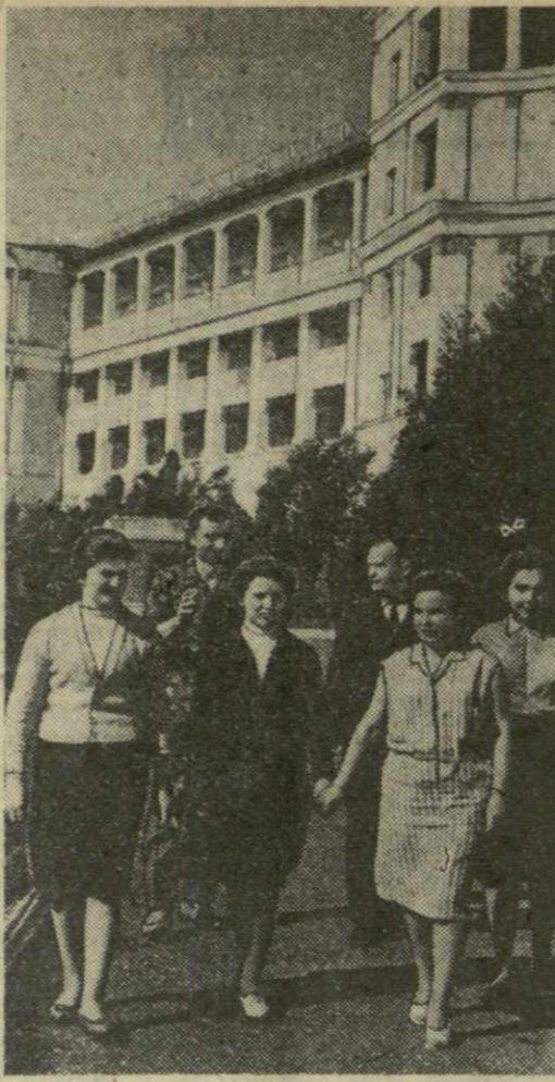
Теплая, солнечная погода установилась на курорте Цхалтубо. Поездами, самолетами, автомашинами сюда ежедневно приезжают много отдыхающих со всех концов страны. В этом году в здравницах Цхалтубо будут лечиться 90 тысяч человек.

На снимке: группа отдыхающих санатория «Тбилиси».