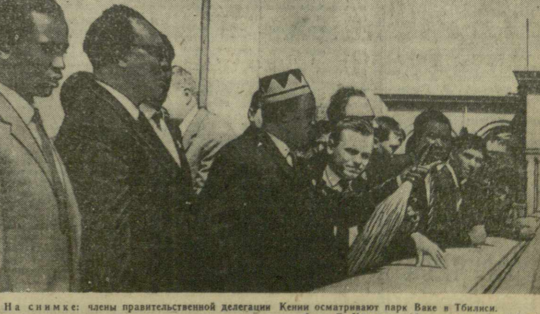
На снимке: члены правительственной делегации Кении осматривают парк Ваке в Тбилиси.

НАЙРОБИ, 27 апреля. (ТАСС). Сегодня сюда прибыла первая советская сельскохозяйственная делегация, в состав которой входят специалисты по различным отраслям сельского хозяйства. Советская делегация побудет в Кении около двух месяцев. За это время она познакомится с сельским хозяйством страны, в частности с животноводством и ирригацией. Она также будет вести переговоры о сотрудничестве Советского Союза и Кении в области сельского хозяйства.