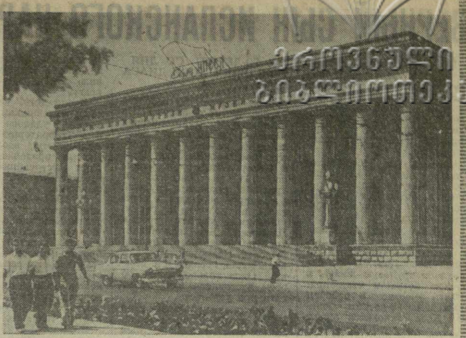
Бакинский филиал Музея В. И. Ленина.

В Азербайджане выросла замечательная плеяда талантливых писателей, поэтов, композиторов, художников, многие произведения которых получили признание не только в нашей стране, но и далеко за ее пределами.