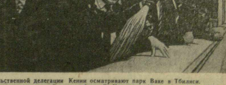
На снимке: члены правительственной делегации Кении осматривают парк Ваке в Тбилиси.

Ужин в честь правительственной делегации Кении. Гости за столом.