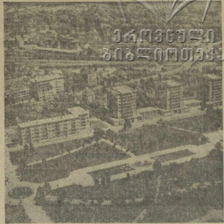
Столица Народной Республики Болгарии — София. Фотохроника ТАСС.

Наша партия, весь наш народ, говорится в заключении редакционной статьи, ясно видит, что партия идет по правильному пути, используя свой опыт и установки XX и XXII съездов КПСС. Только следуя по этому пути, мы можем добиться новых, еще больших успехов, так как это путь творческого и торжествующего марксизма-ленинизма.