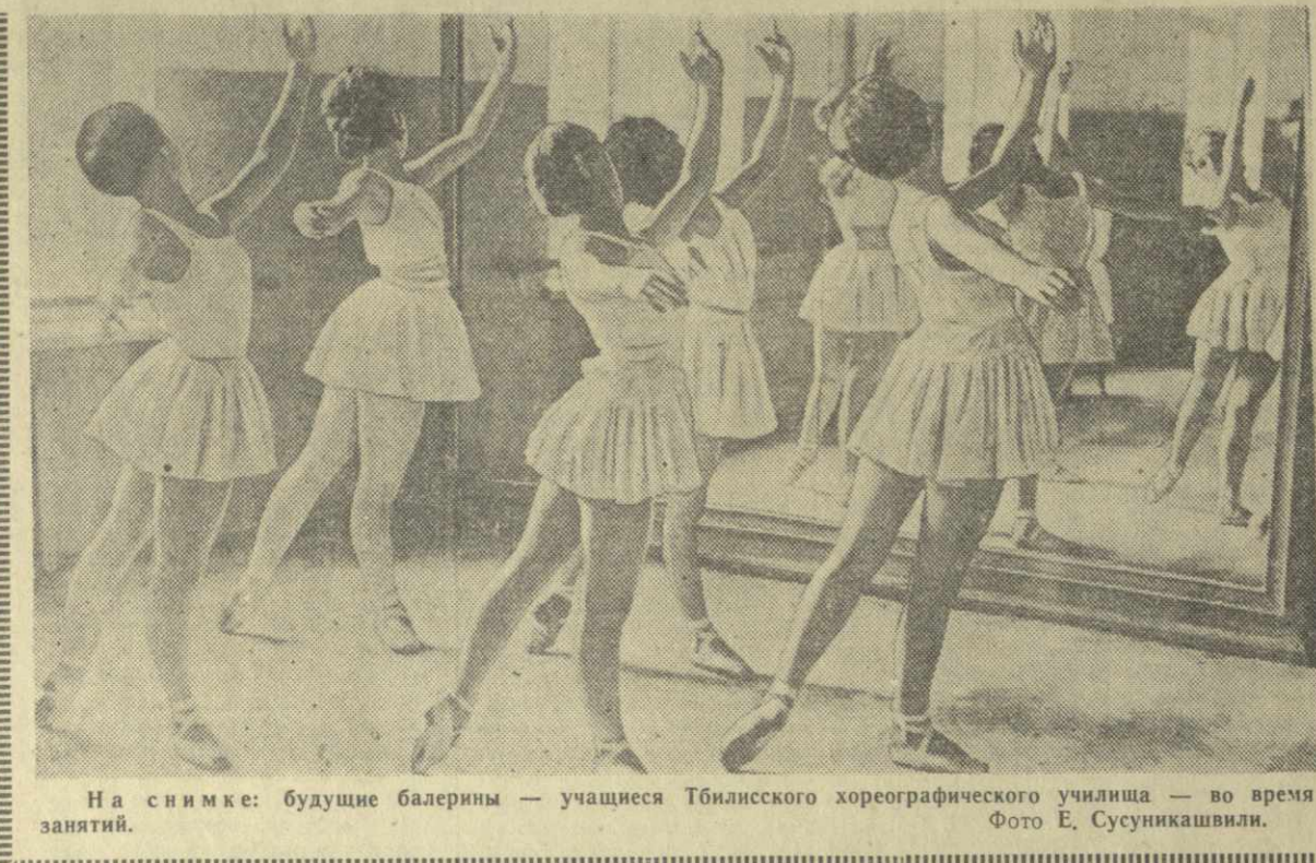
На снимке: будущие балерины — учащиеся Тбилисского хореографического училища — во время занятий.

Со всех концов РЕГИОНАЛИЗМ 350 тонн черного байхового чая отпразднвали в Польше чайные фабрики Аджарии. Древнейшие изделия из керамики найдены в ущельях альпийскими институтами в устье реки Кавриля. Новые автоматы установленные на трубопрокатном стане «140» Руставского металлургического завода. Два опытных образца модернизированных электробуров выпущил Кутанский электромеханический завод. 350 тонн черного байхового чая отпразднвали в Польше чайные фабрики Аджарии. Древнейшие изделия из керамики найдены в ущельях альпийскими институтами в устье реки Кавриля.