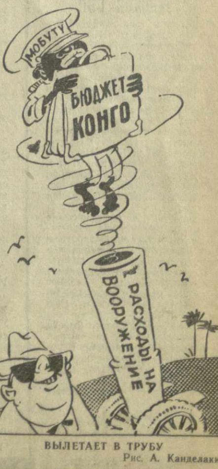
ВЫЛЕТАЕТ В ТРУБУ Рис. А. Канделаки.

В то время, как экономическое положение в Конго все более ухудшается в результате прозападной ориентации правящих кругов и засилия иностранных монополий, военные расходы составляют более четверти бюджета страны. (Из газет).