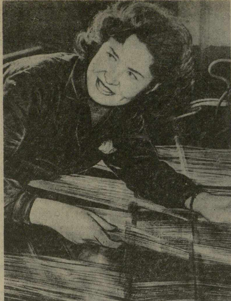
Успешно несет предмайскую трудовую вахту коллектив Зугдидской хлопкоплетальной фабрики. Он вносит свой достойный вклад в осуществление решений декабрьского Пленума ЦК КПСС. С начала нынешнего года на фабрике начал работать новый цех капроновой ткани. Более 8 тысяч метров этой новой продукции выработано на фабрике. Вся ткань из искусственного волокна принята первым сортом.