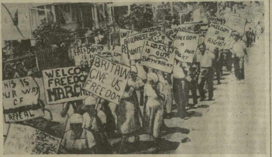
В столице Британской Гвинеи — Джорджтауне проведен марш свободы, в котором приняли участие 10.000 жителей этой английской колонии. Демонстранты прошли по улицам города, затем организовали митинг.

В столице Британской Гвинеи — Джорджтауне проведен марш свободы, в котором приняли участие 10.000 жителей этой английской колонии. Демонстранты прошли по улицам города, затем организовали митинг. На снимке: демонстранты на улице Джорджтауна.