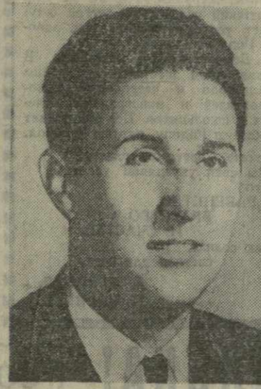
Ахмед Бен Белла,

Высокого звания лауреата Ленинской премии за 1963 год