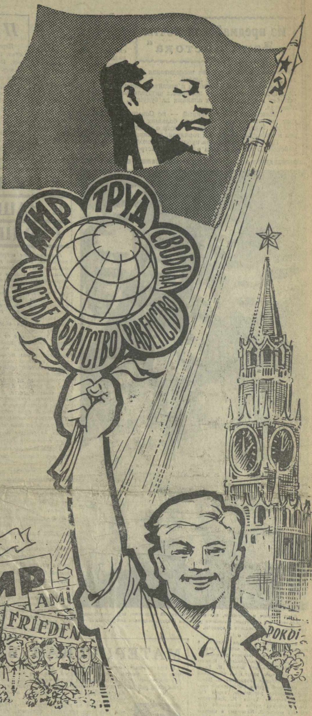
Плакат худ. А. Канделаки.

ЦХИНВАЛИ. Добрую славу завоевала продукция цхинвальского завода «Электровибромашина». Она пользуется большим спросом не только в нашей республике, но и за ее пределами. В канун первомайского праздника коллектив завода отправил образцы своей продукции — электровибромашин, бункера и другие изделия — на выставку достижений народного хозяйства СССР.