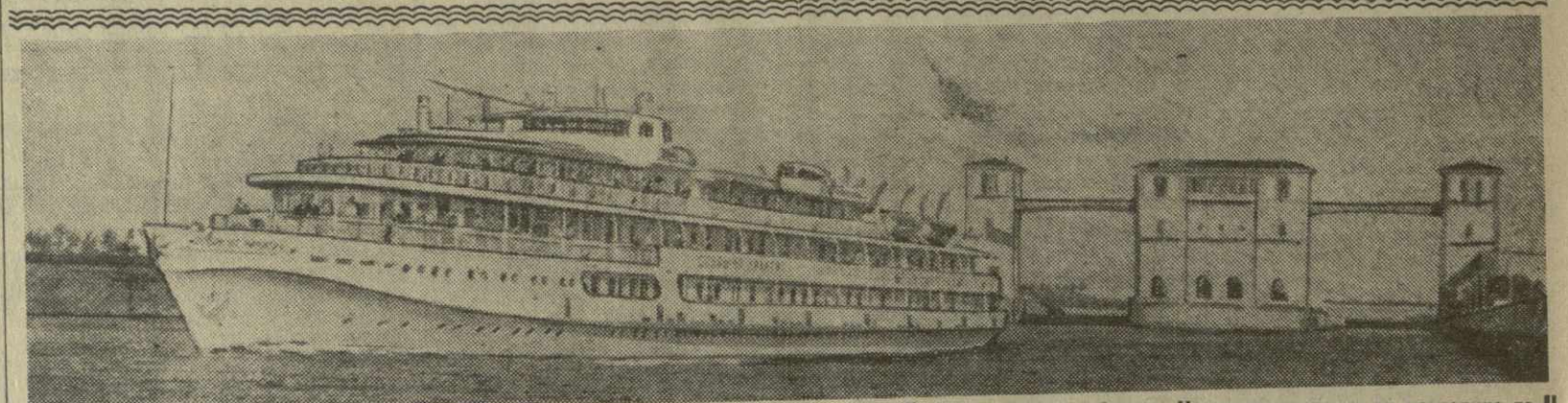
Ярославская область. Неузнаваемо стало за последние годы Рыбинское море — одно из первых крупных искусственных водохранилищ, созданных советскими людьми.

ВЫИГРАЛ «КАПРАТ». 4:2 — таков результат первого выступления в Иране футболистов алмаатинского «Капрата». В Тегеране они победили команду «Шахрия».